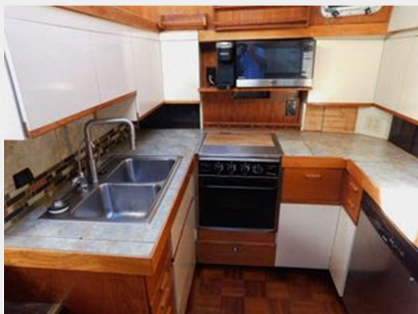
Gulfstar 49 Flybridge Motoryacht - Galley