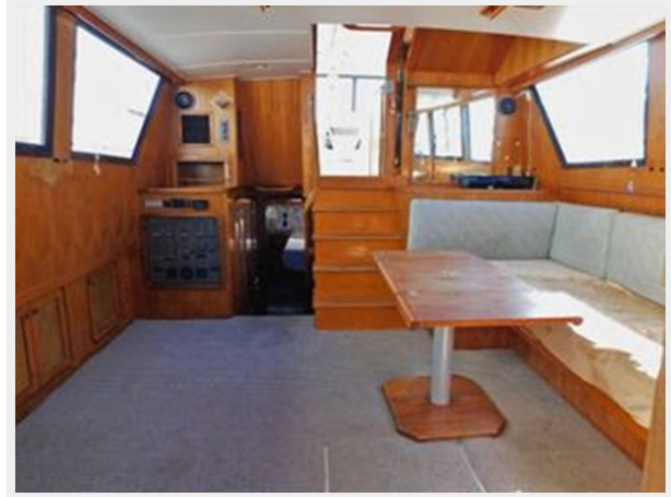
Gulfstar 49 Flybridge Motoryacht - Looking Aft