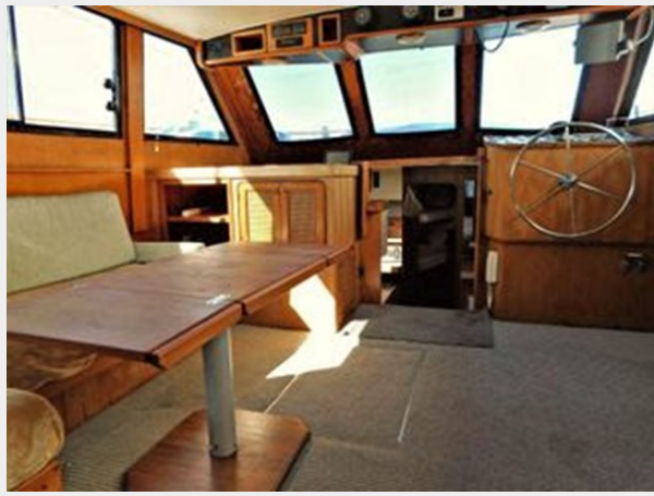
Gulfstar 49 Flybridge Motoryacht - Looking Forward