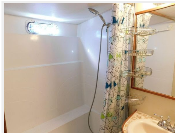
Gulfstar 49 Flybridge Motoryacht - Aft Cabin