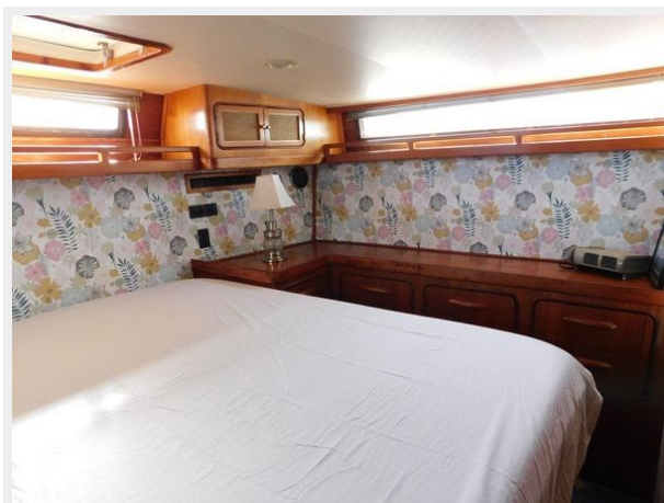
Gulfstar 49 Flybridge Motoryacht - Aft Cabin