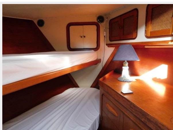
Gulfstar 49 Flybridge Motoryacht - Forward Cabin