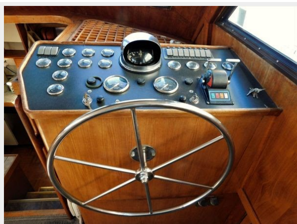
Gulfstar 49 Flybridge Motoryacht - Helm