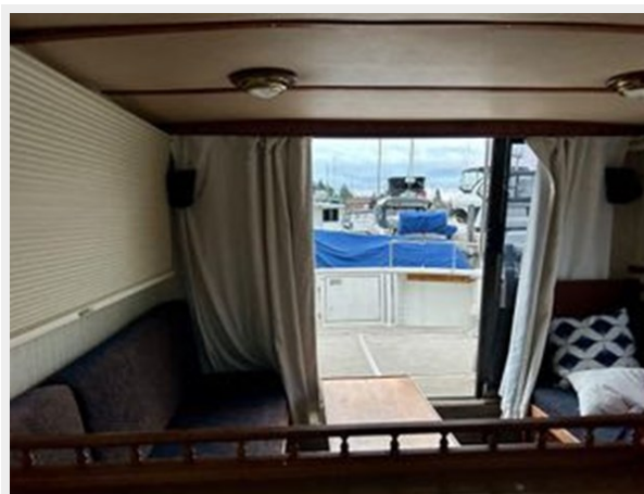
Uniflite 32 Sport Sedan - Looking Aft