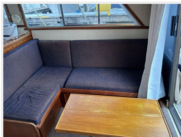
Uniflite 32 Sport Sedan - Salon Table