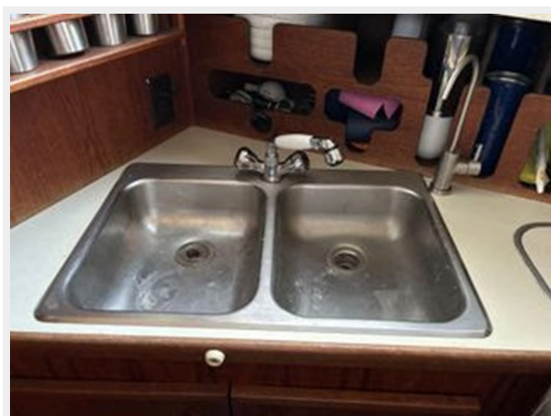
Uniflite 32 Sport Sedan - Galley