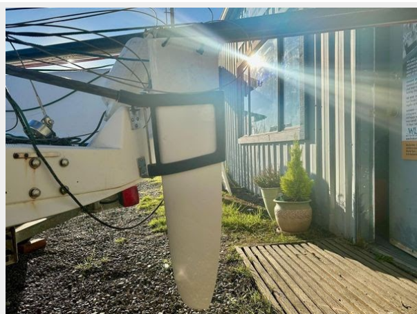
Beneteau First 18 - Exterior