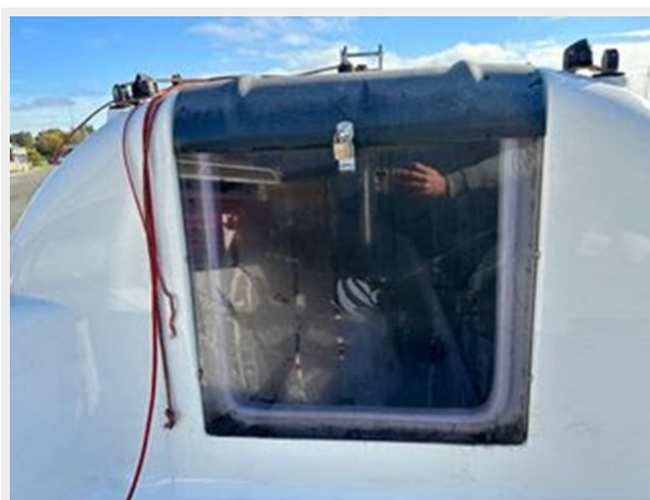
Beneteau First 18 - Companionway