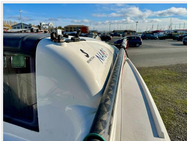
Beneteau First 18 - Side Deck