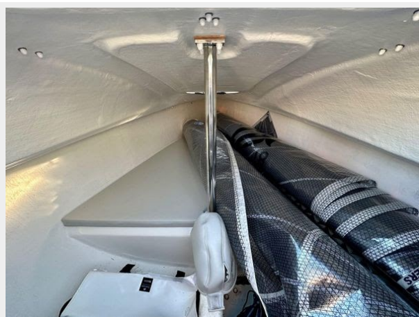
Beneteau First 18 - Interior