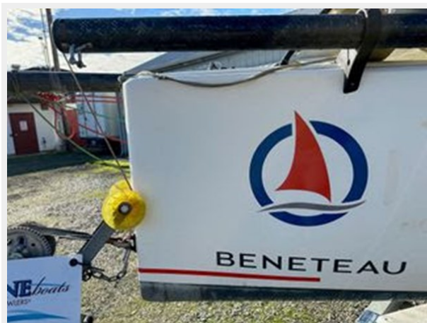
Beneteau First 18 - Bow