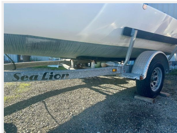
Beneteau First 18 - Trailer