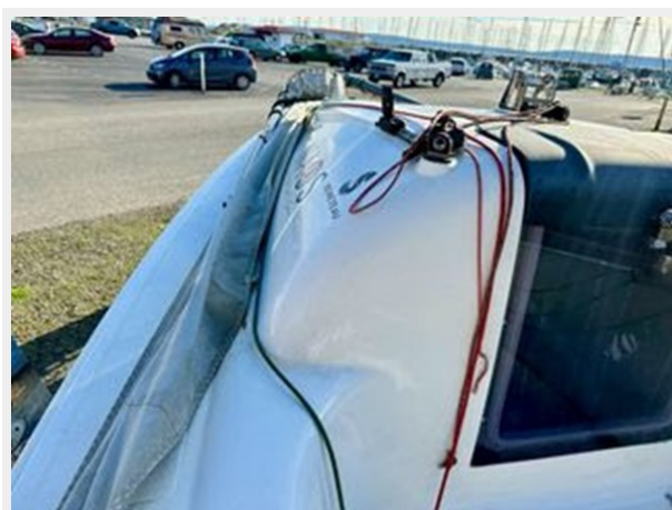
Beneteau First 18 - Side Deck