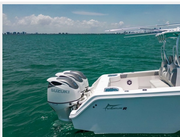
35_Streamline-_-28 - Copy