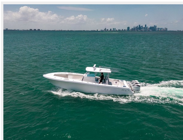
35_Streamline-_-34 - Copy