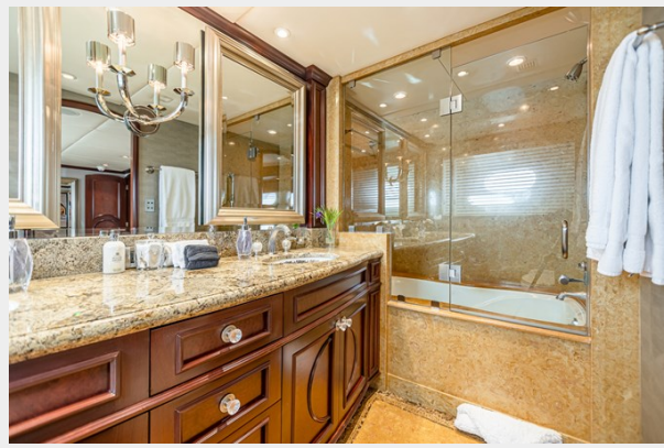
Guest Bath - Stbdside Aft