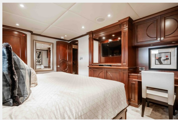
Guest Stateroom - Portside Aft