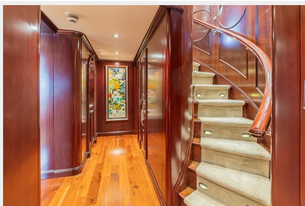
Lower Deck - Foyer