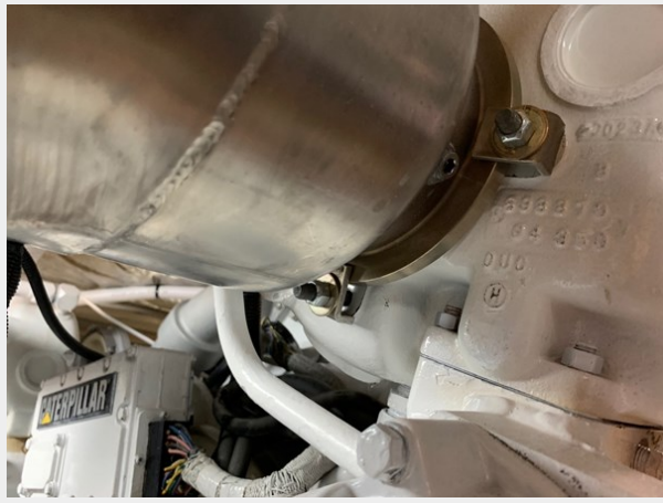
Engine Room Exhaust