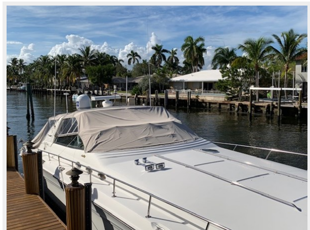
Forward Deck Area