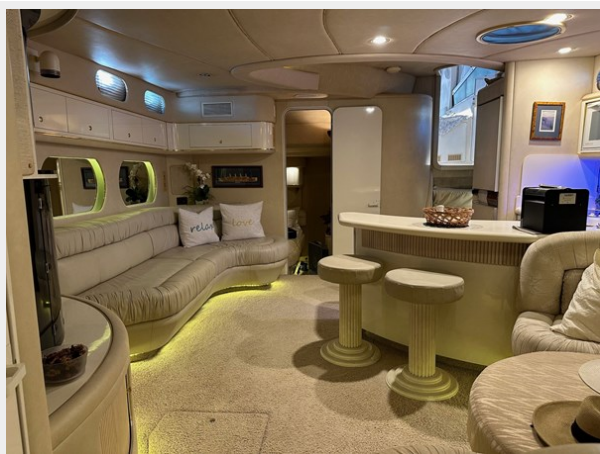
Salon looking aft to guest SR and stairs up to helm deck