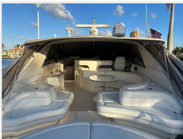
Cockpit deck looking fwd to helm area