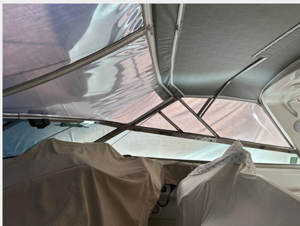
Covered helm and cockpit interior