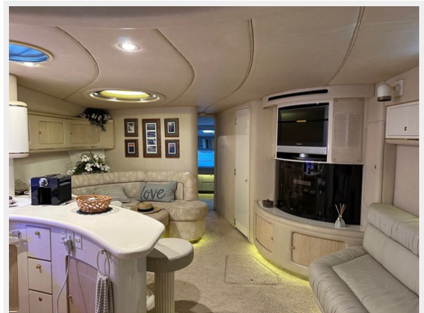
Salon Looking Fwd