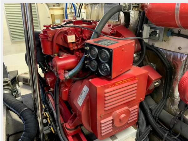
Main Gen Set Engine Room