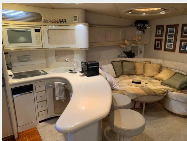
Galley and Port Side Salon