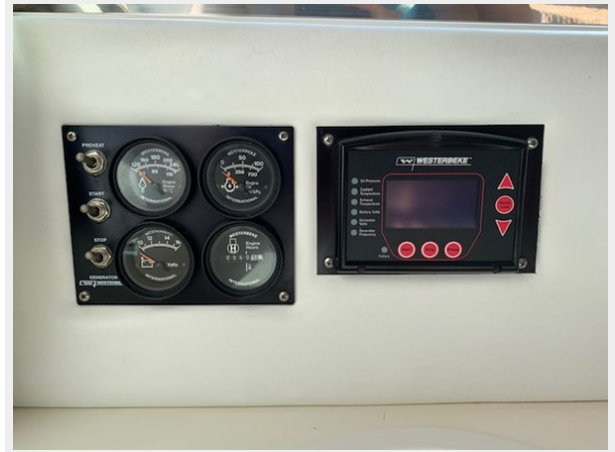
2nd Gen Control Panel