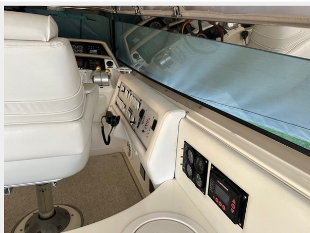
Helm Area Control Panel to Stbd