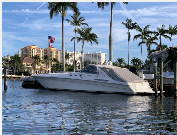
Port Side At Dock