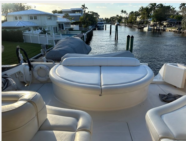
Cockpit area sunpad and transom door to swim platform