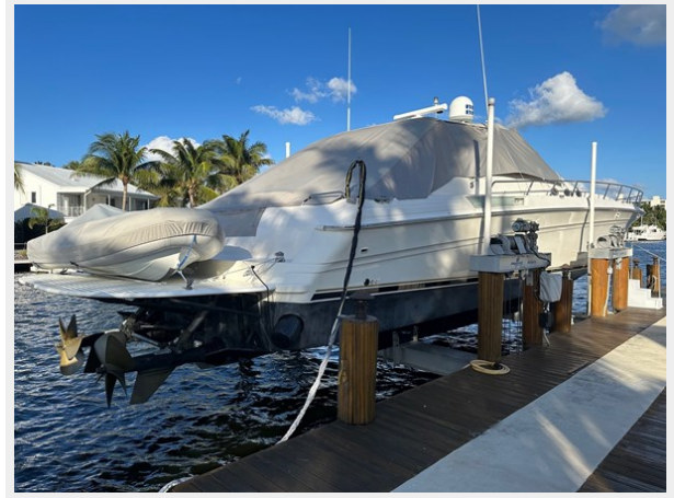
Stbd side on lift