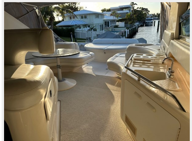
Looking Aft to Cockpit Deck