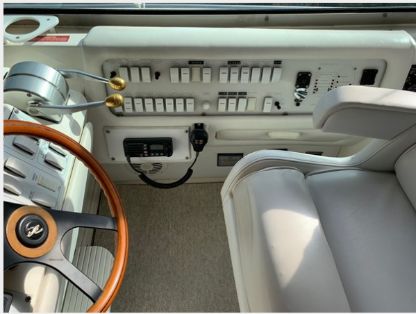
Control Panel Stbd of Helm