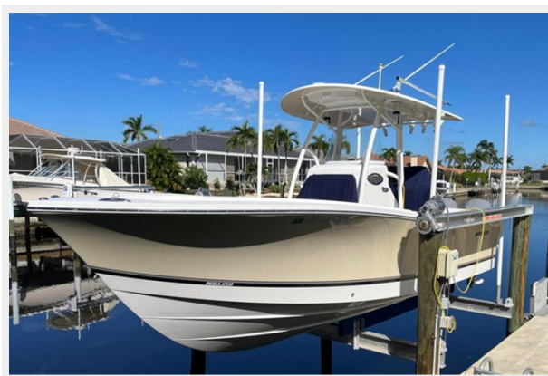
004 - Profile on boatlift