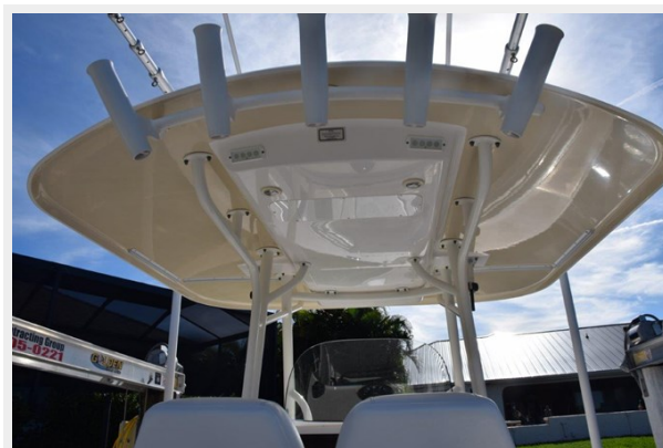
Underside hardtop color matched to hull sides