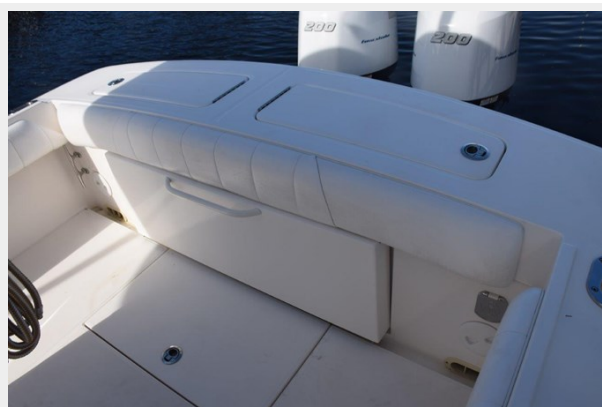
016 - Cockpit