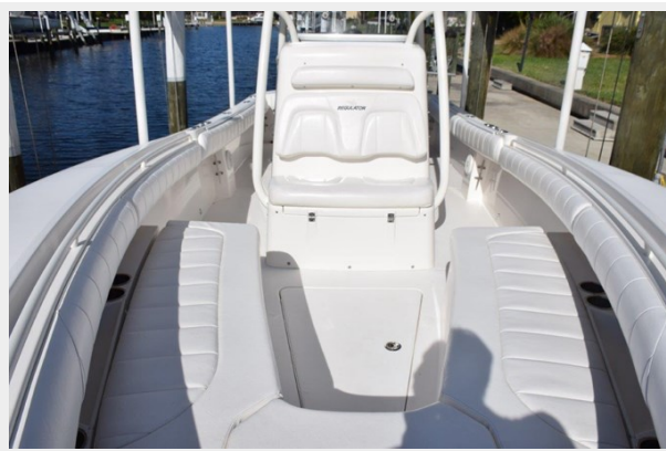
026 - Cushion for forward seating are indoor stored when not in use