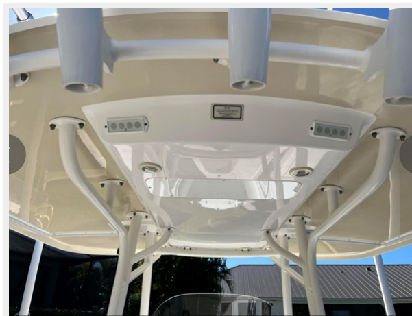
007 - Hardtop