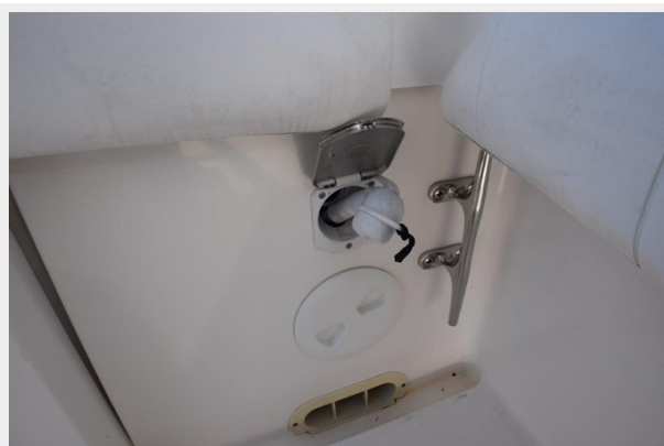
020 - Fresh water shower hose