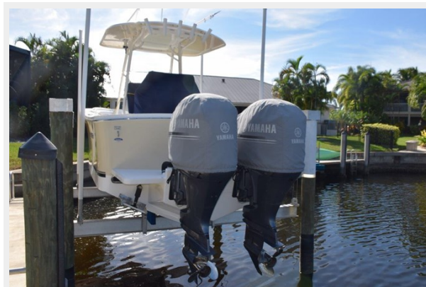
Yamaha engine covers