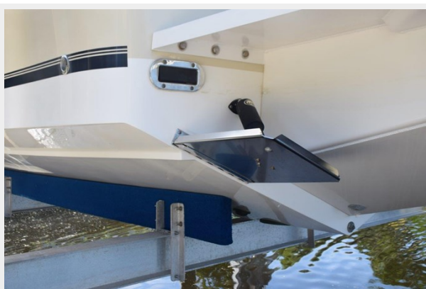
No bottom paint, always lift kept