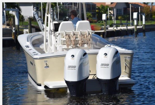
003 - White Yamaha cowling mounted on bracket