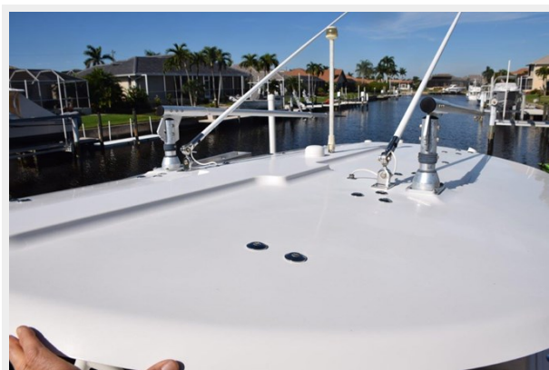
Factory hardtop with antenna and lights on pivot mounts