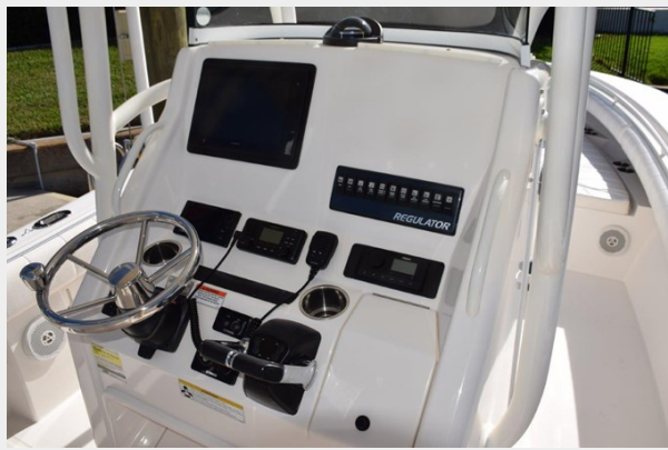
Helm has drink holders and glovebox