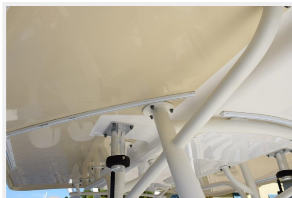
015 - Sidewinder outriggers and track for enclosure