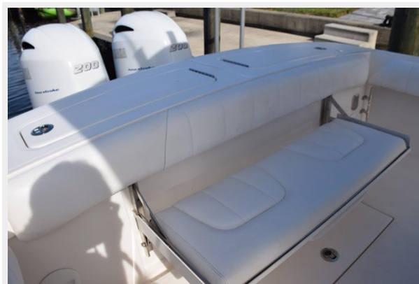
019 - Fold down rear bench seat (1)