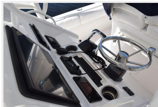
013 - Tiltable helm wheel with speed knob