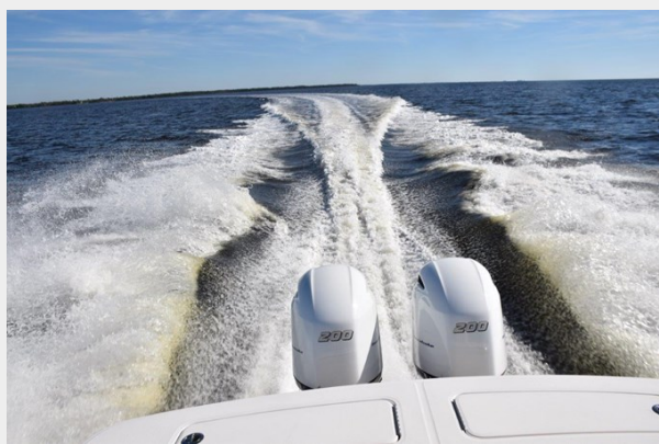
Easy cruise at 30+ knots