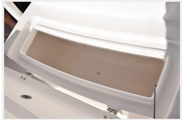
Cooler beneath forward console seat