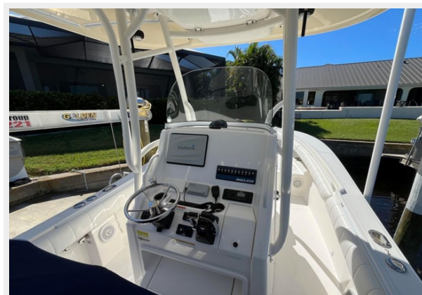
009 - Helm