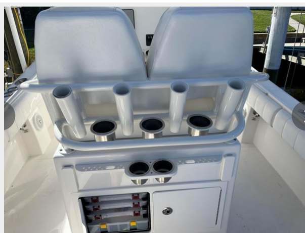
022 - Rocket launcher, tackle cabinet