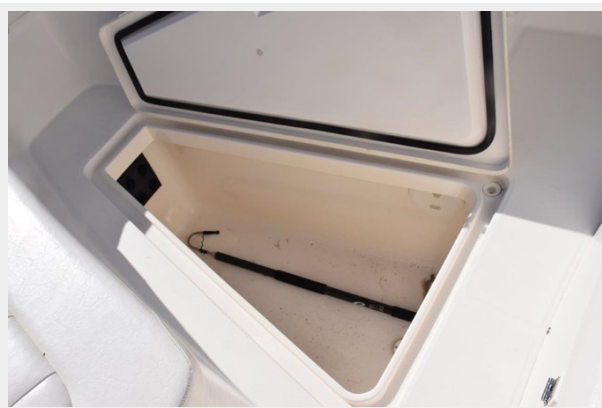
028 - Huge fishbox (or rod storage) beneath forward seating deck