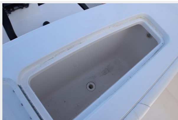
018 - Transom fishbox