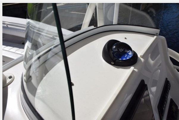
012 - Curved plex windshield and magnetic compass