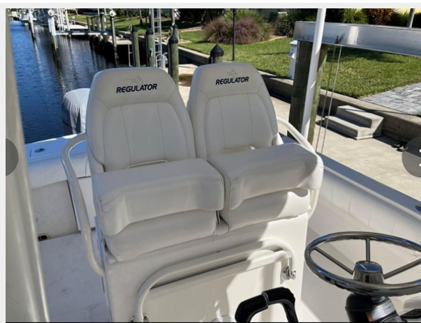
008 - Helm seats