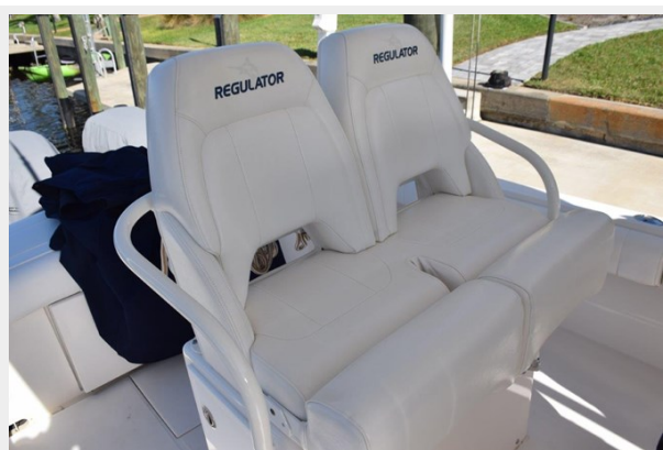
010 - Seats with bolsters down