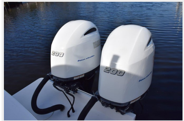
Yamaha with low hours and recent service