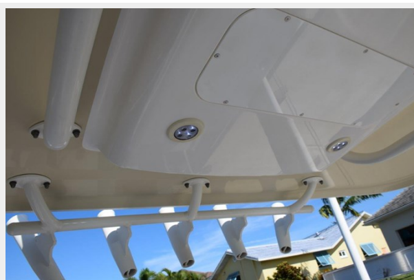
014 - White powder coating and LED hardtop lights