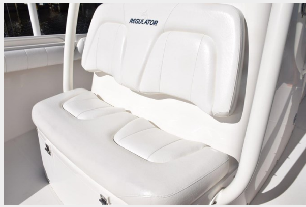
024 - Forward console seat