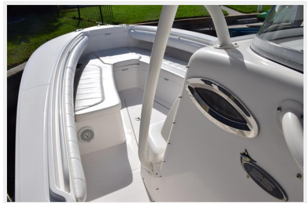
027 - Full coaming pads, opening portlight to beneath console