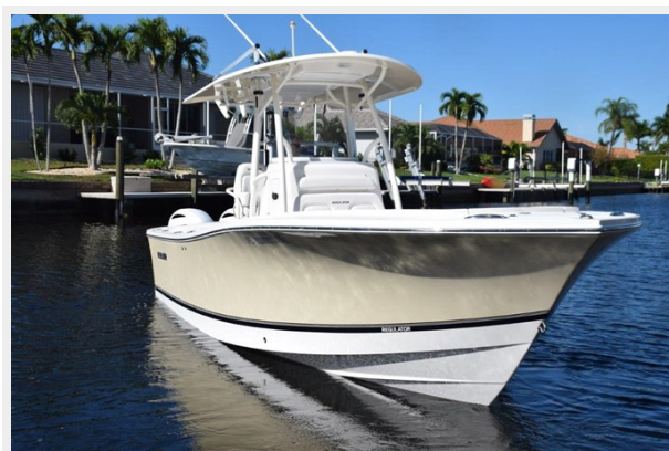
002 - Bow profile