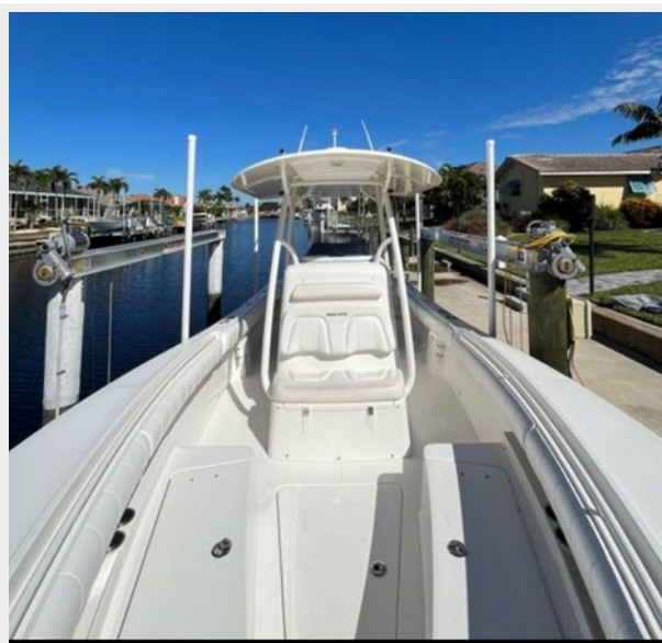
006 - Aft view from bow