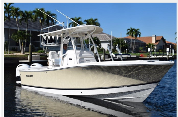
Attractive shear line