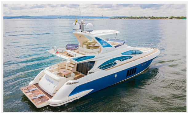
WhatsApp Image 2023-12-04 at 3.19.21 PM