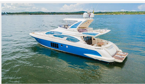
WhatsApp Image 2023-12-04 at 3.19.21 PM (1)