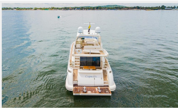
WhatsApp Image 2023-12-04 at 3.19.20 PM (3)