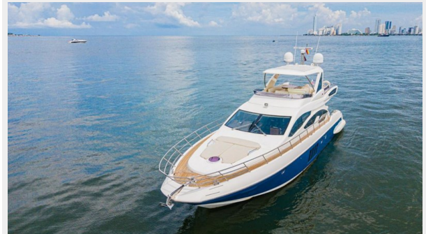
WhatsApp Image 2023-12-04 at 3.19.20 PM (2)