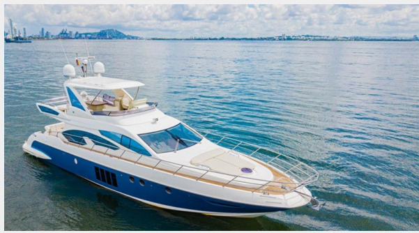
WhatsApp Image 2023-12-04 at 3.19.20 PM (1)