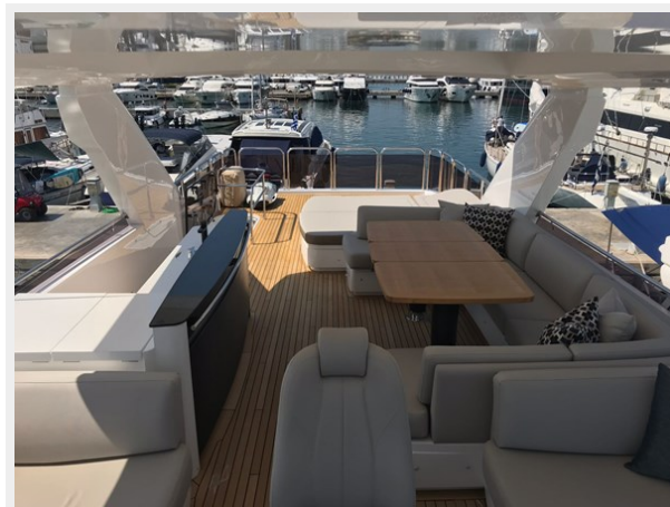
PRINCESS 82 M.Y 2018 (11)