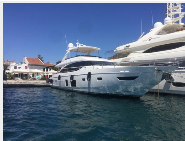
PRINCESS 82 M.Y 2018 (2)