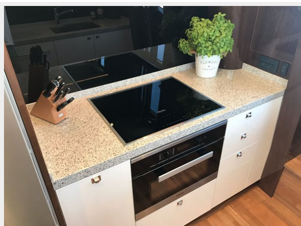
PRINCESS 82 M.Y 2018 (8)