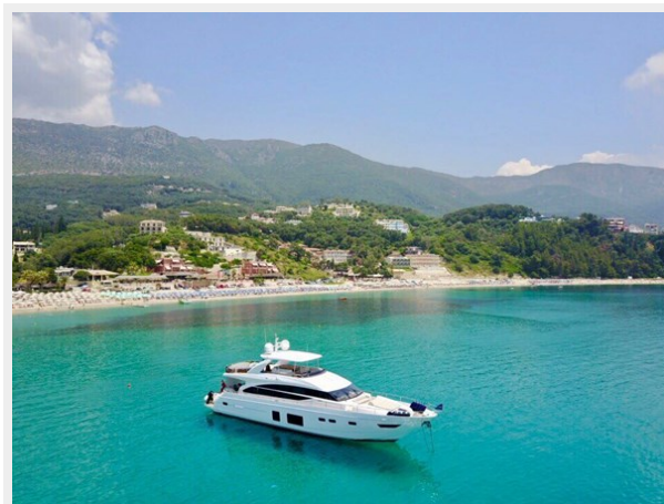
PRINCESS 82 M.Y 2018 (9)