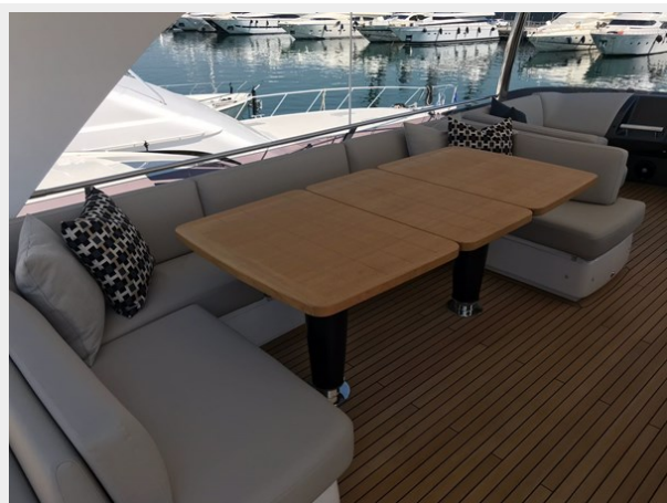
PRINCESS 82 M.Y 2018 (12)