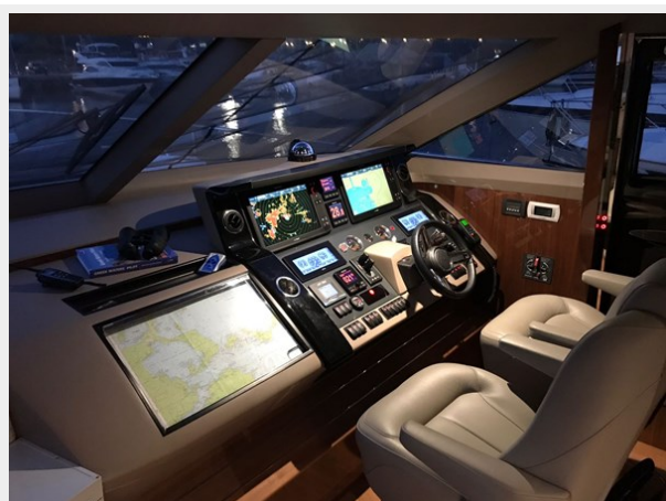
PRINCESS 82 M.Y 2018 (4)