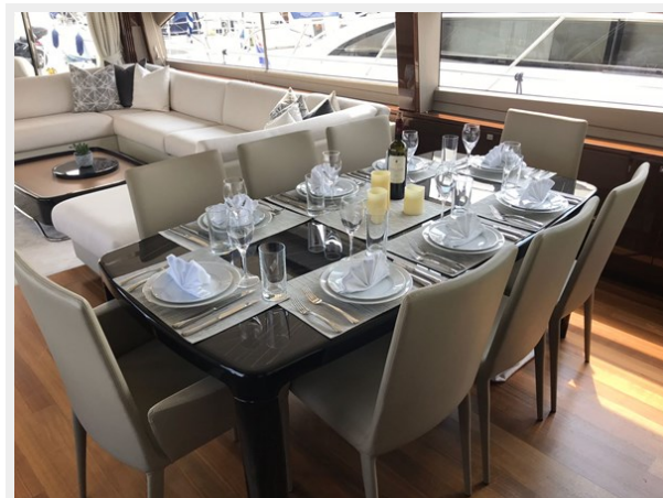
PRINCESS 82 M.Y 2018 (6)