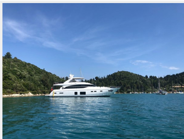
PRINCESS 82 M.Y 2018 (1)