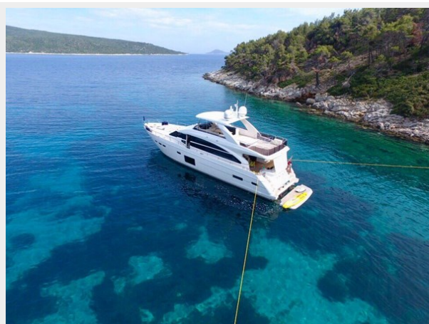
PRINCESS 82 M.Y 2018 (3)