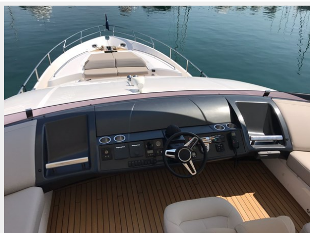
PRINCESS 82 M.Y 2018 (3)