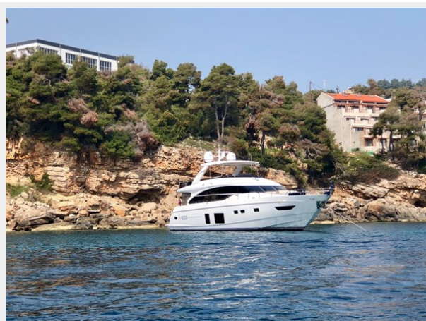
PRINCESS 82 M.Y 2018 (7)