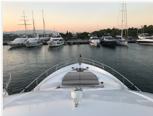
PRINCESS 82 M.Y 2018 (5)