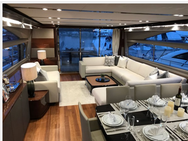
PRINCESS 82 M.Y 2018 (7)