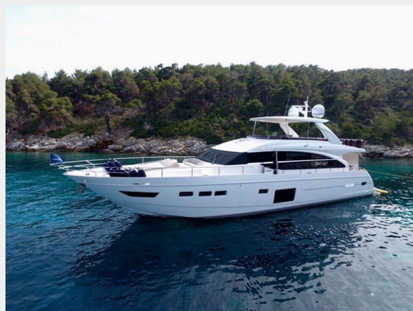
PRINCESS 82 M.Y 2018 (5)