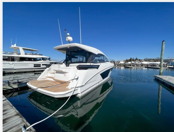
BENETEAU GRAN TURISMO 45 SWIM PLATFORM