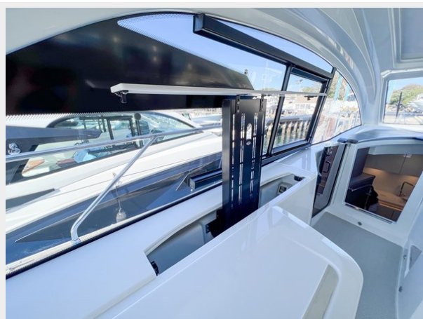
BENETEAU GRAN TURISMO 45