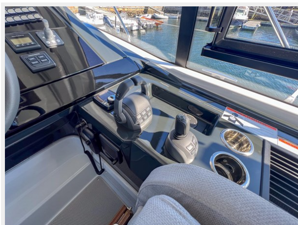
BENETEAU GRAN TURISMO 45