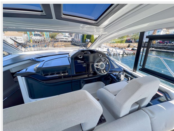
BENETEAU GRAN TURISMO 45 COCKPIT