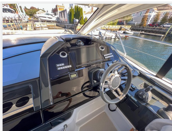
BENETEAU GRAN TURISMO 45 HELM