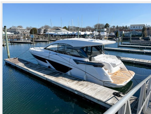
BENETEAU GRAN TURISMO 45