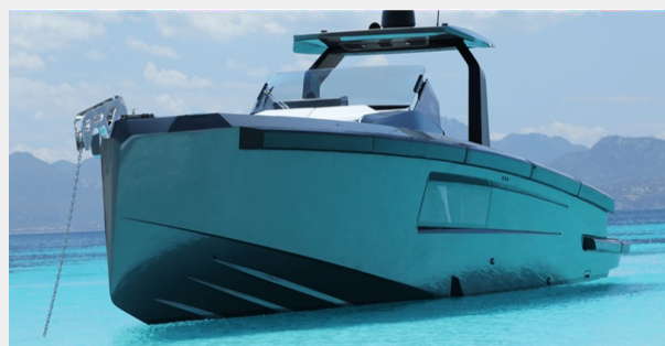
MAORI 54 FAMILY VERSION - 2024 MOTOR YACHT FOR SALE | EXTERIOR (1)