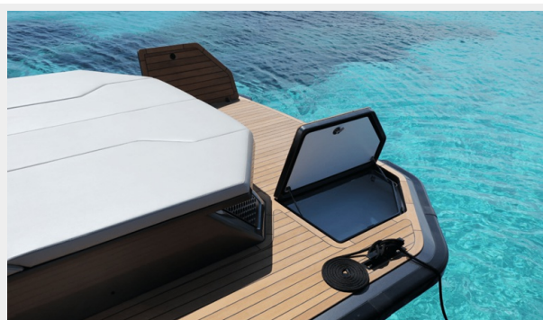
MAORI 54 FAMILY VERSION - 2024 MOTOR YACHT FOR SALE | EXTERIOR (5)