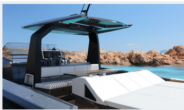
MAORI 54 FAMILY VERSION - 2024 MOTOR YACHT FOR SALE | EXTERIOR (3)