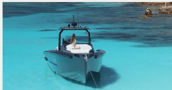
MAORI 54 FAMILY VERSION - 2024 MOTOR YACHT FOR SALE | EXTERIOR (2)