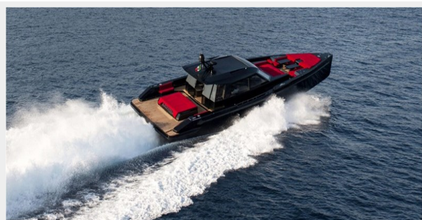
MAORI 78 - 2024 MOTOR YACHT FOR SALE MAORI 78 - 2024 MOTOR YACHT FOR SALE | INTERIOR (1) | EXTERIOR (3)