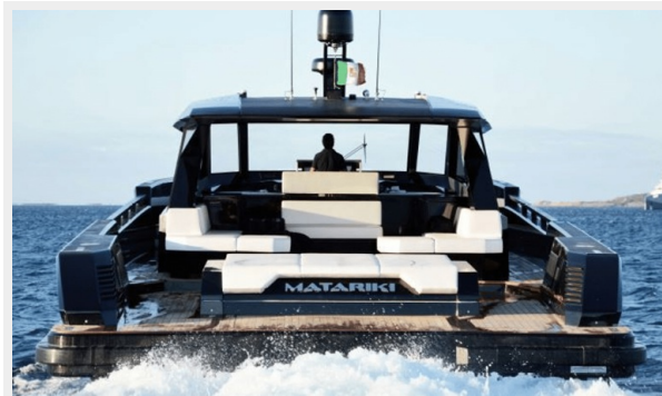
MAORI 78 - 2024 MOTOR YACHT FOR SALE MAORI 78 - 2024 MOTOR YACHT FOR SALE | EXTERIOR (4) | EXTERIOR (5)