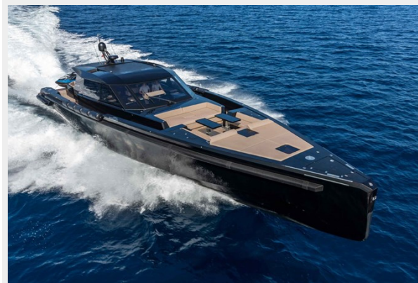
MAORI 78 - 2024 MOTOR YACHT FOR SALE | EXTERIOR (1)