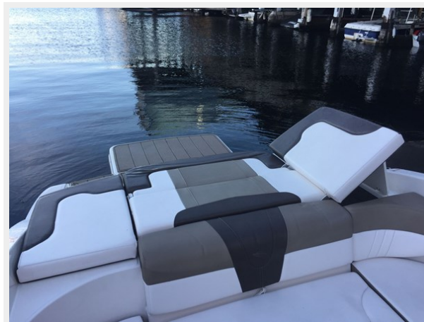
Chaperral 230 ssi - Stern