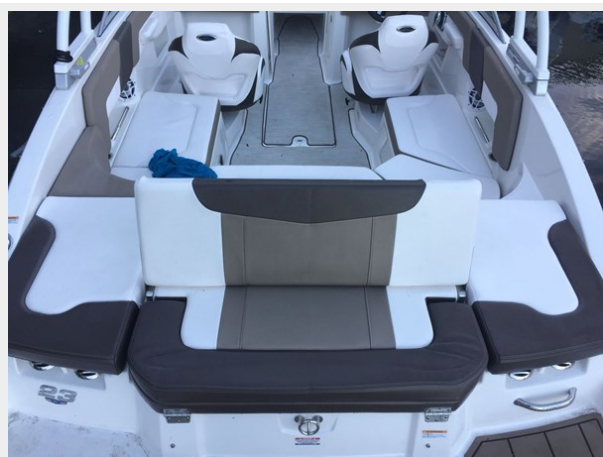
Chaperral 230 ssi - Looking Forward