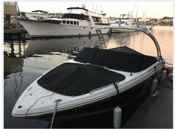
Chaperral 230 ssi - canvas covers