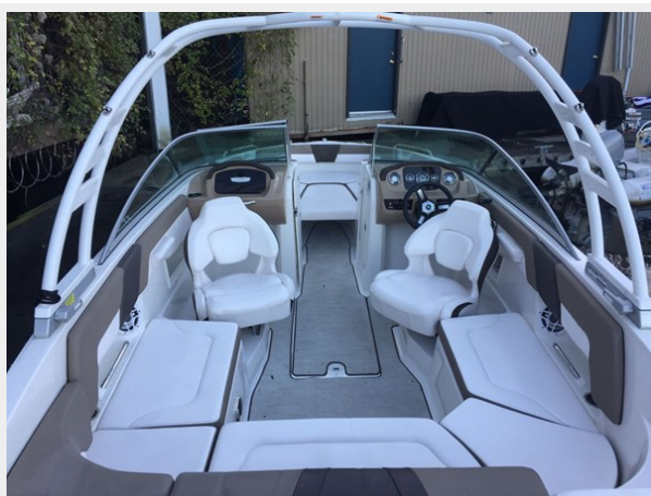
Chaperral 230 ssi - Cockpit Seating