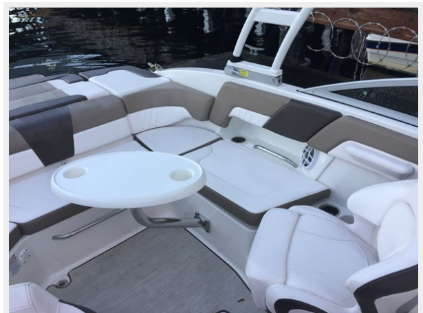
Chaperral 230 ssi - Cockpit Table