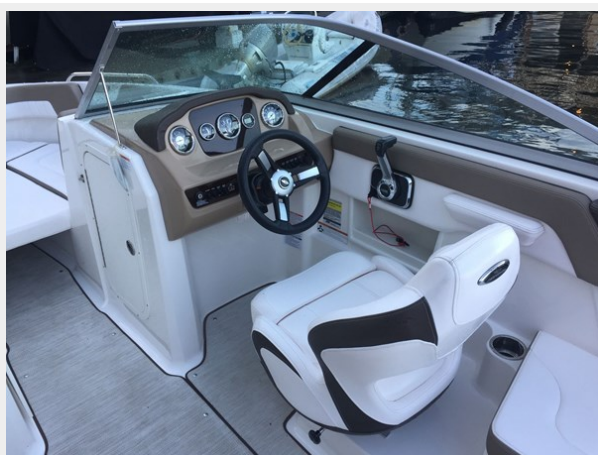
Chaperral 230 ssi - Helm