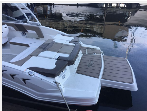
Chaperral 230 ssi - Swim Platform