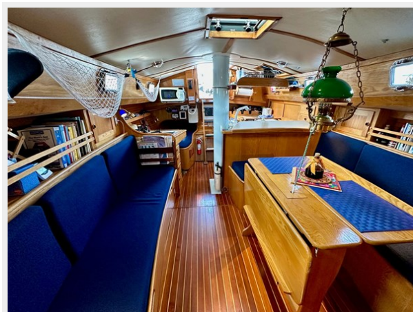
Freedom 33-MKII Cat Ketch - Looking Aft