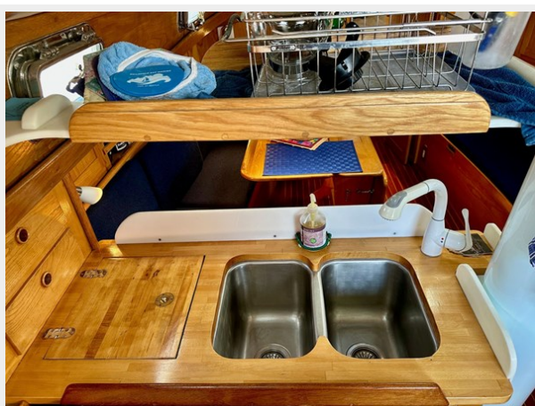
Freedom 33-MKII Cat Ketch - Galley