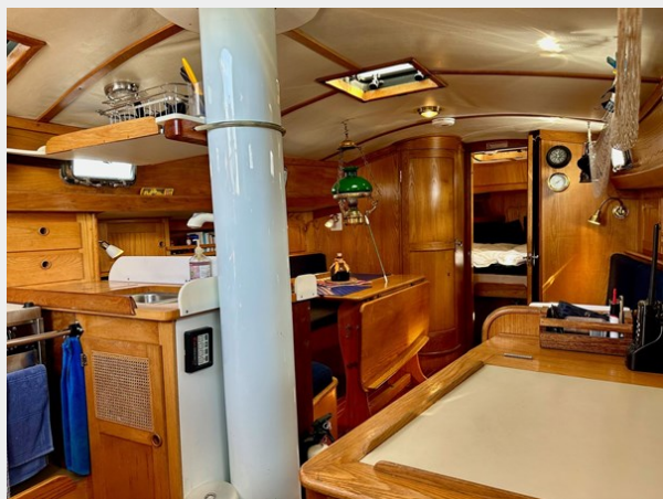
Freedom 33-MKII Cat Ketch - Looking forward