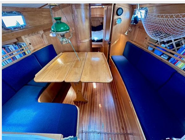
Freedom 33-MKII Cat Ketch - Saloon