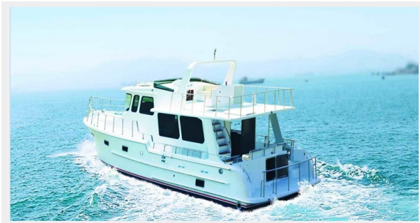
PS Stern view