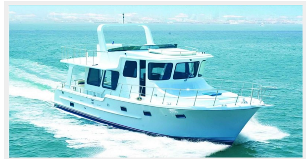
SB Bow view