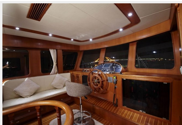
Lounge Helm station