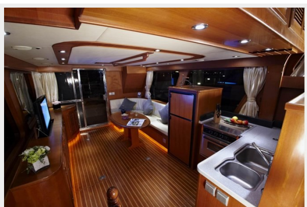
Lounge to stern