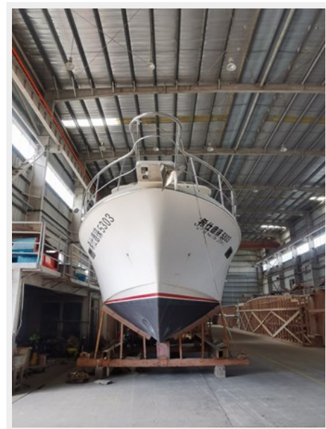
Bow on the hard