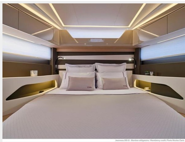
Jeanneau DB 43 - Mention obligatoire / Mandatory credit: Photo Nicolas Clark