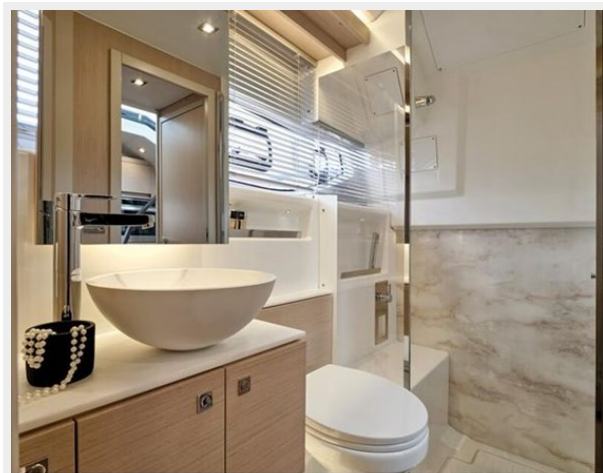
Jeanneau DB 43