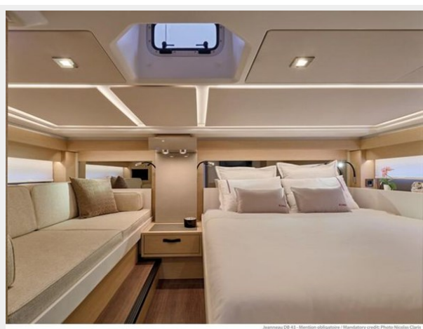
Jeanneau DB 43