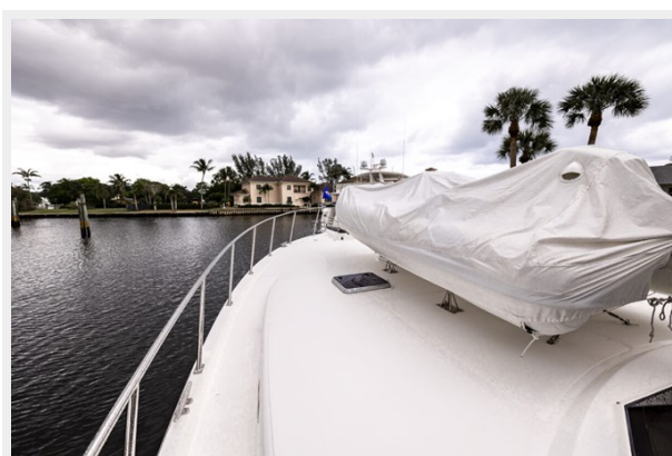
Foredeck / Tender Storage