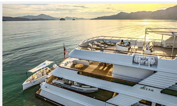
CRN Side View