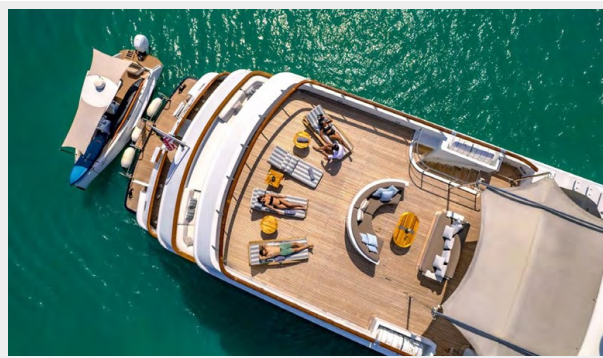
CRN Sun deck