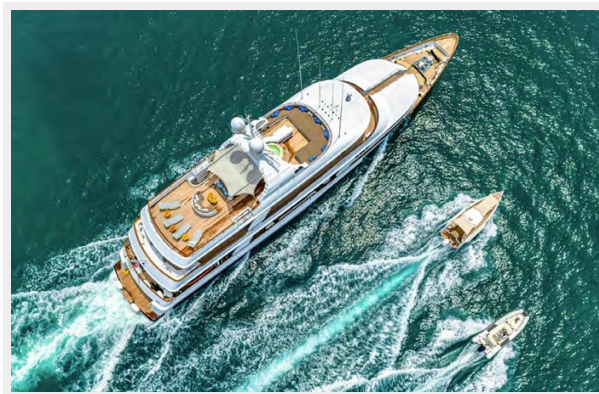
CRN in Navigation