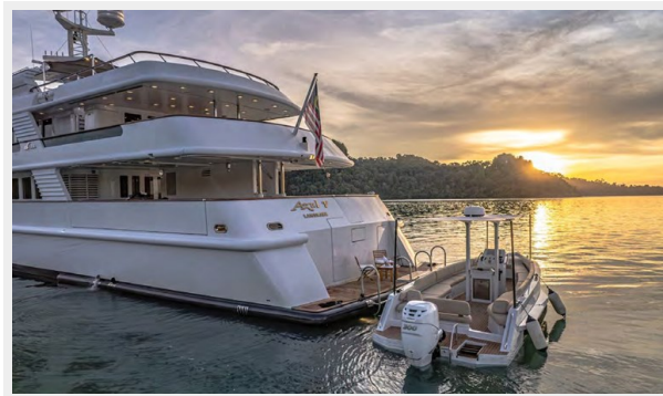
CRN Stern + Tender