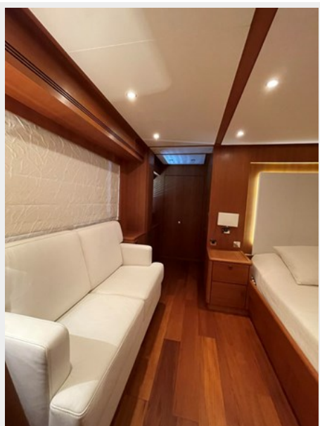
MASTER CABIN 1111