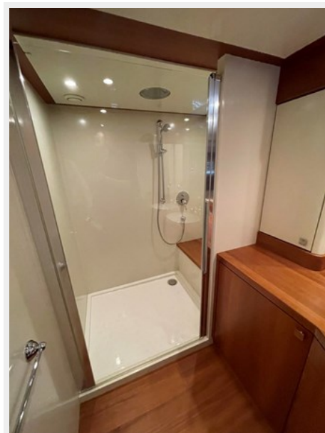
MASTER CABIN BATHROOM 3