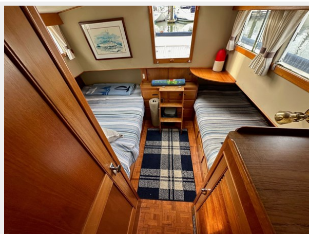
Grand Banks 36 Aft Cabin