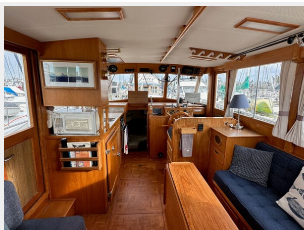
Grand Banks LF