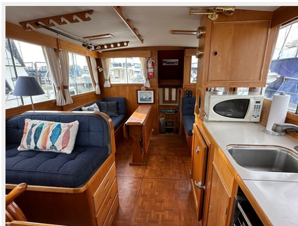
Grand Banks 36 LA