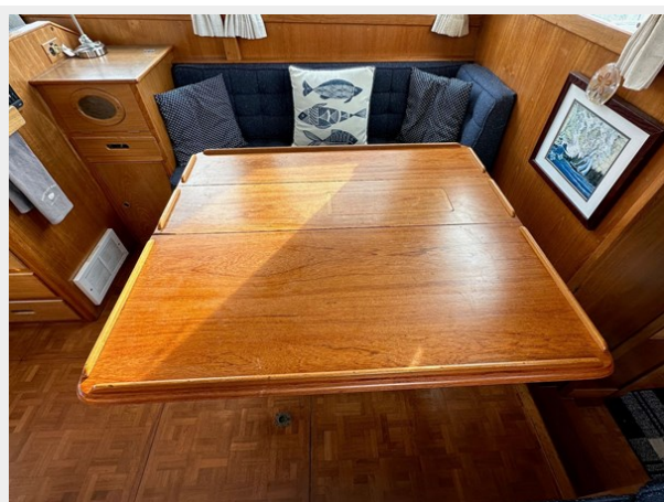
Grand Banks 36 Salon Table