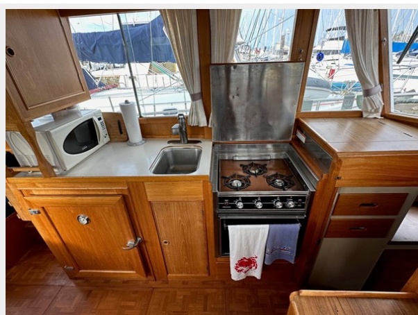
Grand Banks 36 - Galley