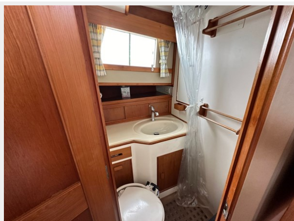
Grand Banks 36 Heads 2