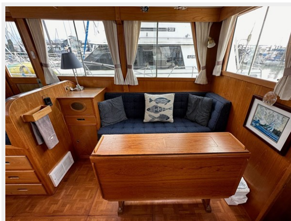
Grand Banks 36 Salon