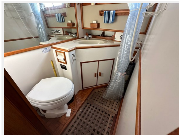
Grand Banks 36 Head