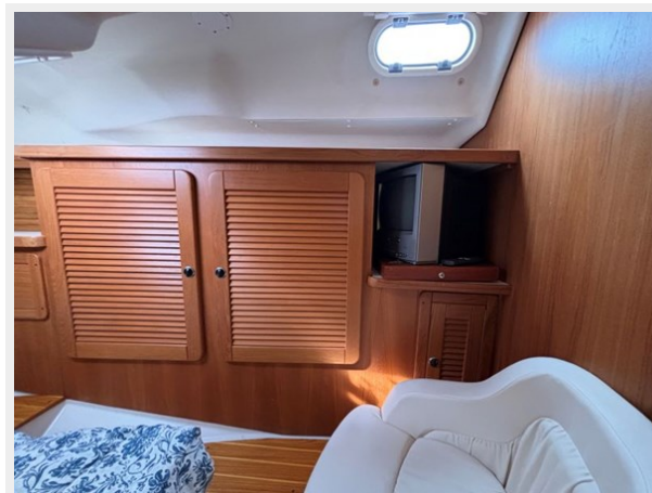
Aft Stateroom Lockers