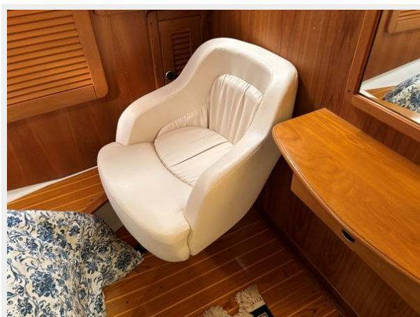
Aft Stateroom Dressing Table and Chair