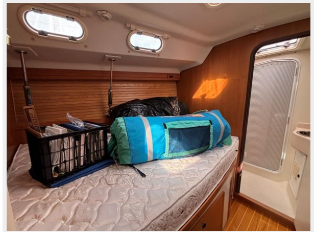
Forward Pullman Berth