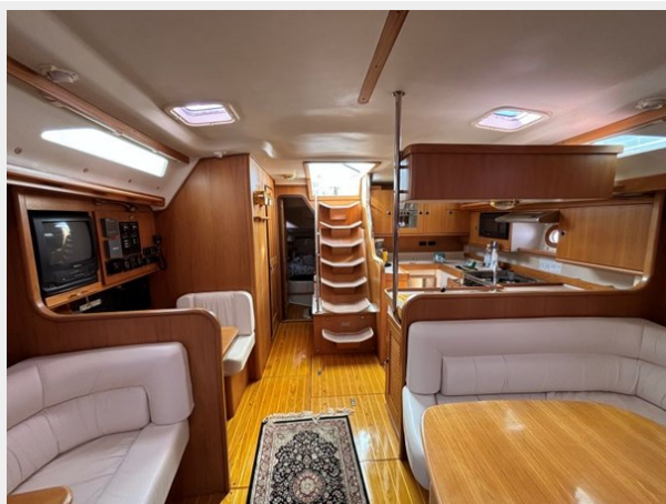
Main Salon Looking Aft