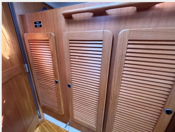
Forward Stateroom Storage