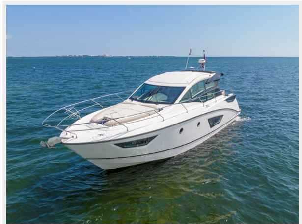
3 - Сору (2) - Сору