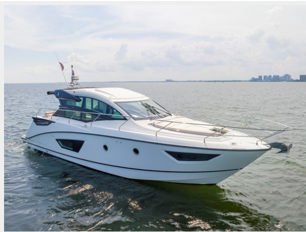
2 - Сору - Сору