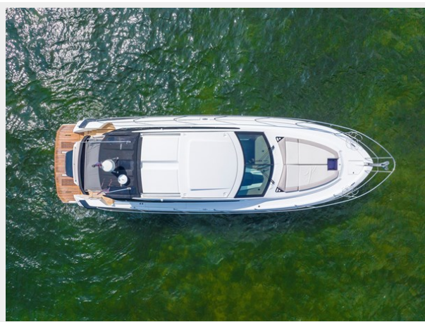
4 - Сору (2)