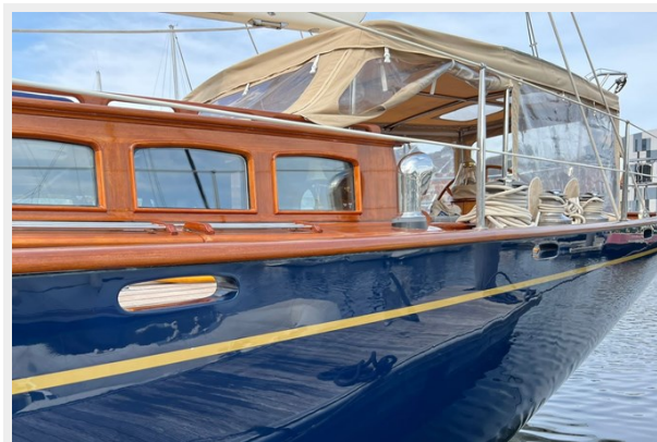
Hoek truly Classic 75 12