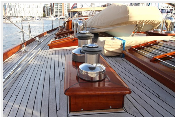
Hoek truly Classic 75 11