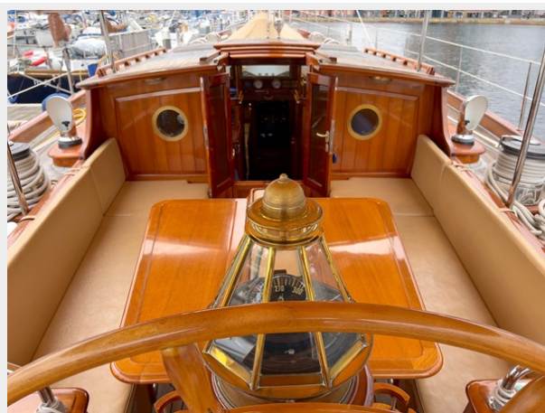
Hoek truly Classic 75 6