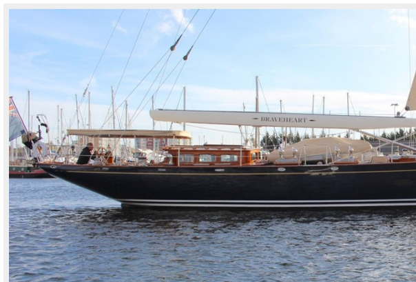
Hoek truly Classic 75 1