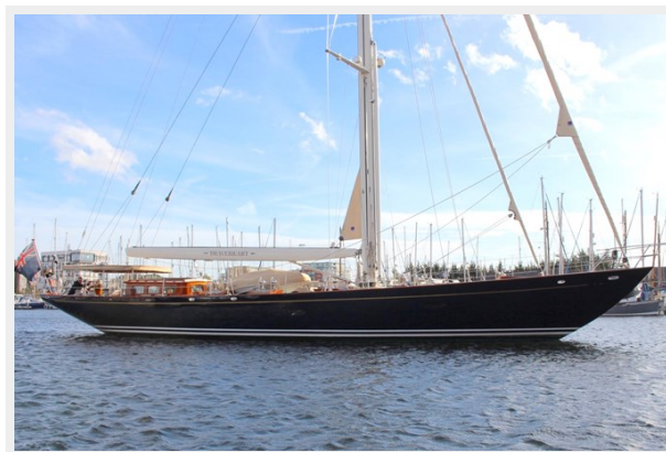
Hoek truly Classic 75 3