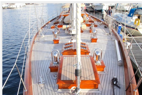
Hoek truly Classic 75 13