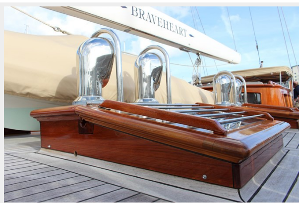
Hoek truly Classic 75 2