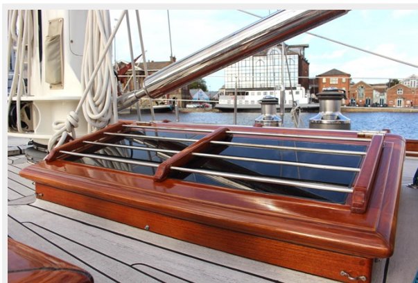
Hoek truly Classic 75 14