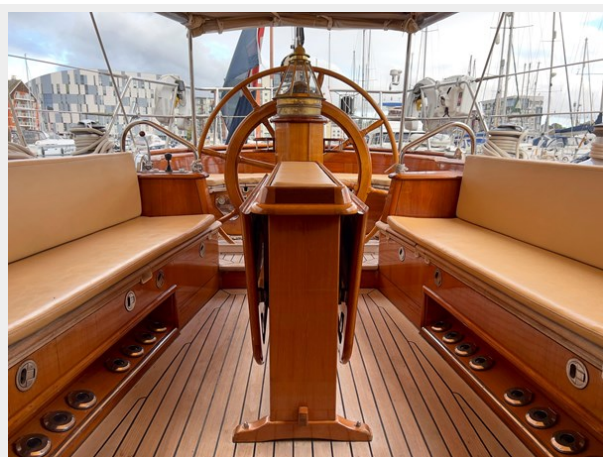
Hoek truly Classic 75