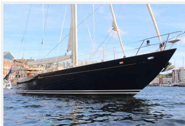
Hoek truly Classic 75 7