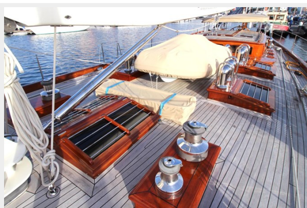
Hoek truly Classic 75 8