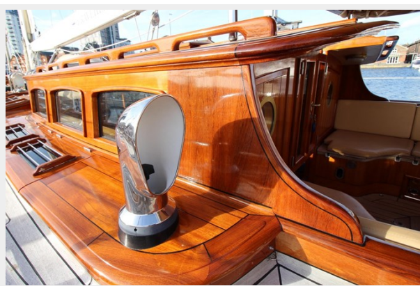
Hoek truly Classic 75 4