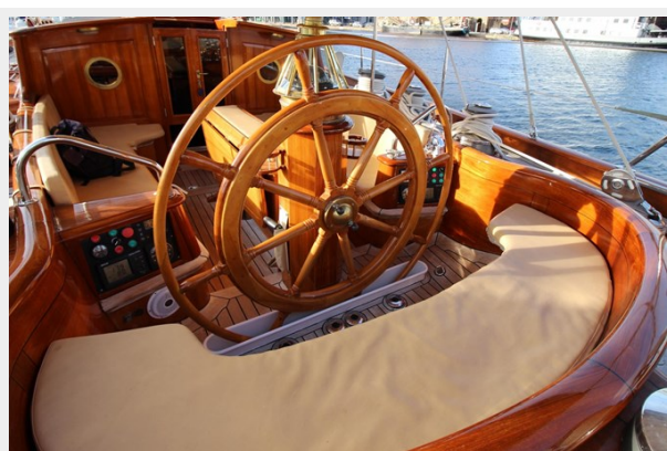
Hoek truly Classic 75 9