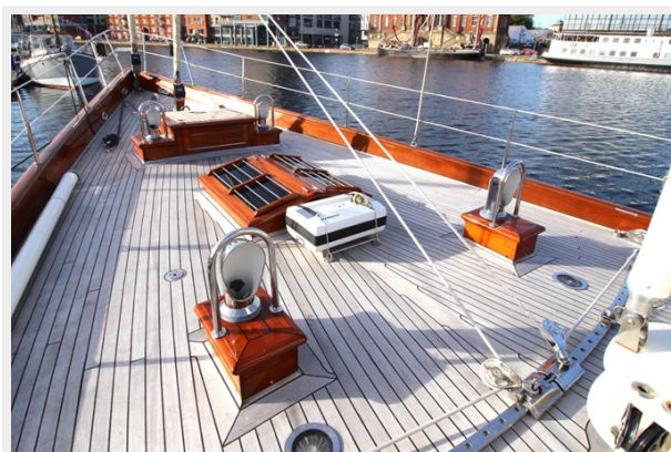
Hoek truly Classic 75 15