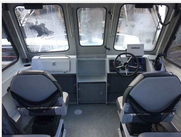
Hewescraft 220 - Helm Companion Seating