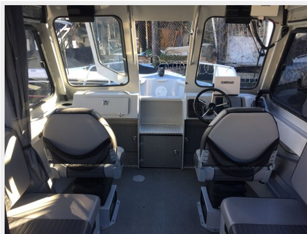
Hewescraft 220 - Looking Forward