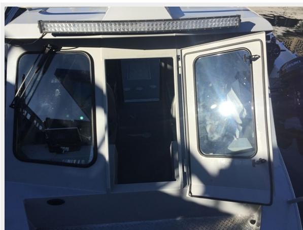
Hewescraft 220 - forward Companionway