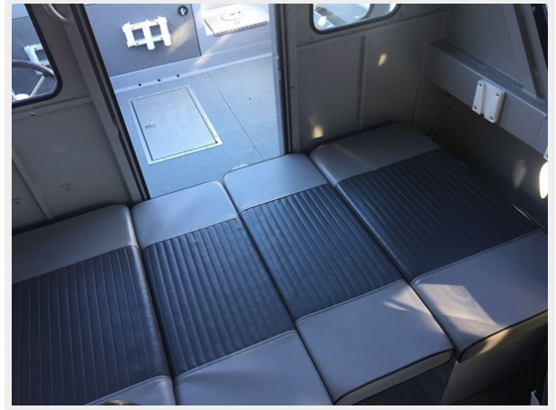
Hewescraft 220 - Convertible Sleeping