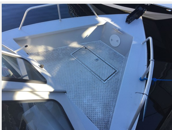
Hewescraft 220 - Bow