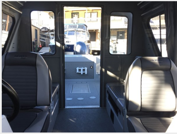
Hewescraft 220 - Looking Aft