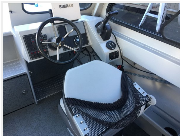
Hewescraft 220 - Helm