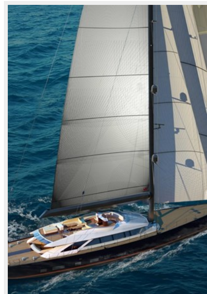
50M Running SBS