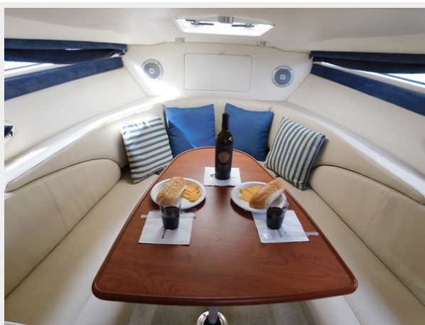
Bayliner 265 - Salon