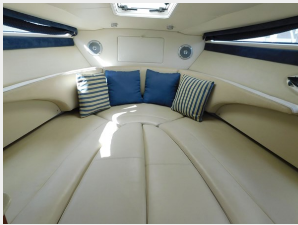
Bayliner 265 - Forward Cabin