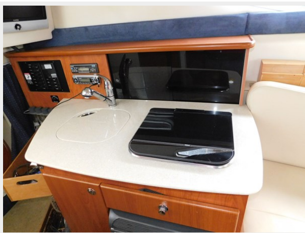
Bayliner 265 - Galley