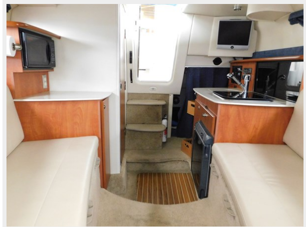
Bayliner 265 - Looking Aft