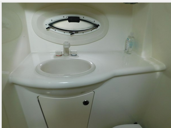
Bayliner 265 - Head