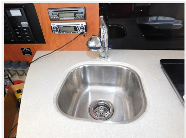
Bayliner 265 - Galley Sink