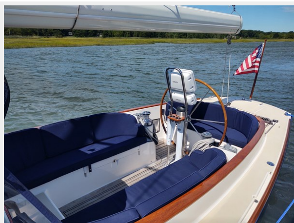
Phoenix Cockpit with cushions out