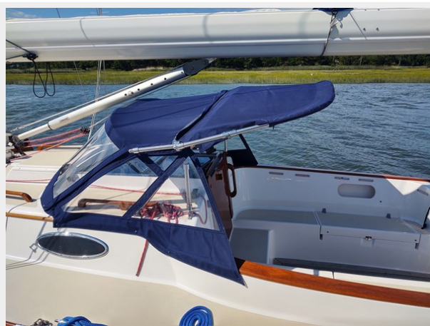
Phoenix Dodger extention