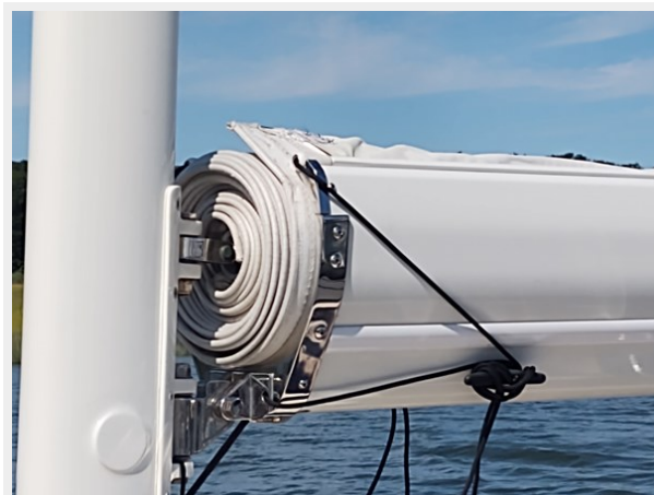
Phoenix In-Boom Leisurefurl luff