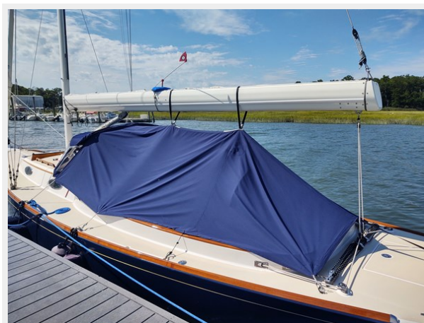
Phoenix Cockpit cover