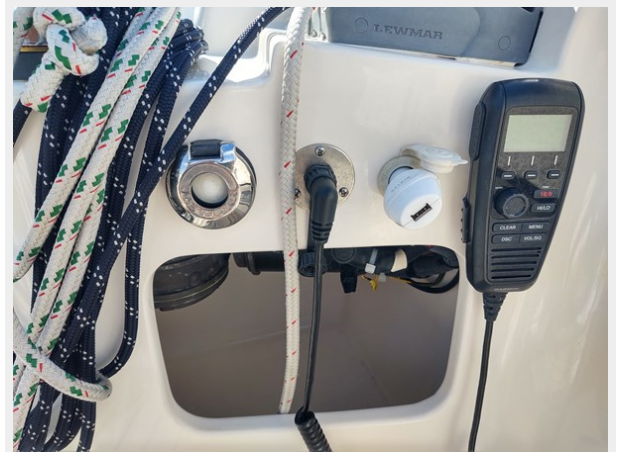
Phoenix VHF at helm