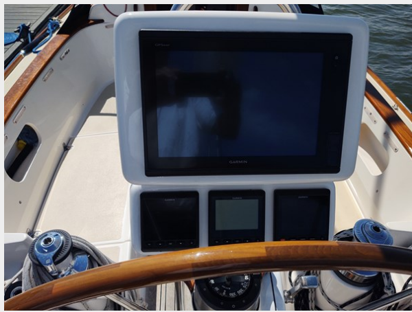
Phoenix Electronics at Helm