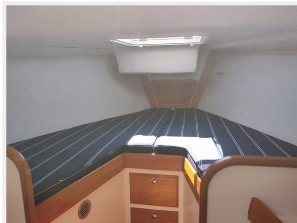
Phoenix Vee Berth