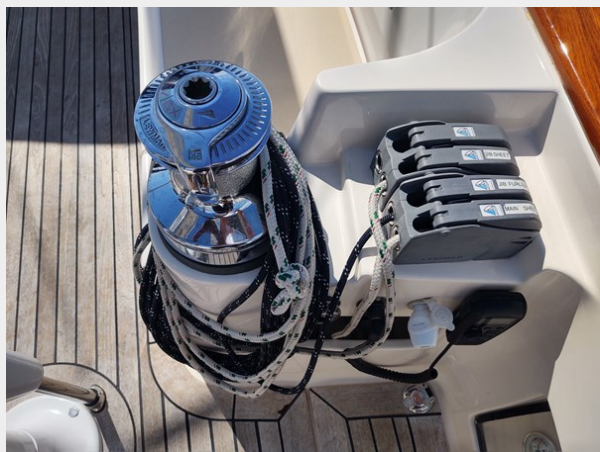
Phoenix electric winch and stoppers stbd