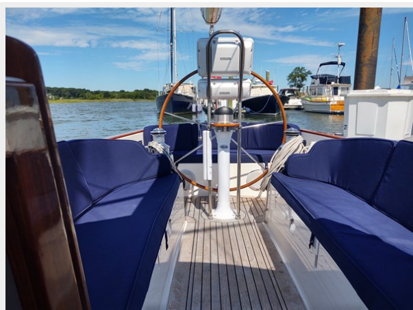
Phoenix Cockpit from fwd