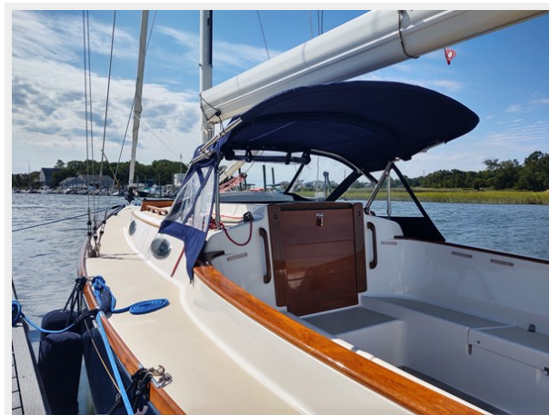
Phoenix Dodger with extension