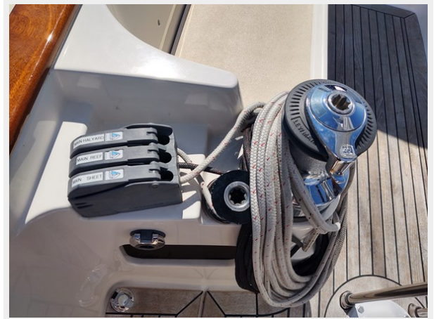
Phoenix electric winch and stoppers port