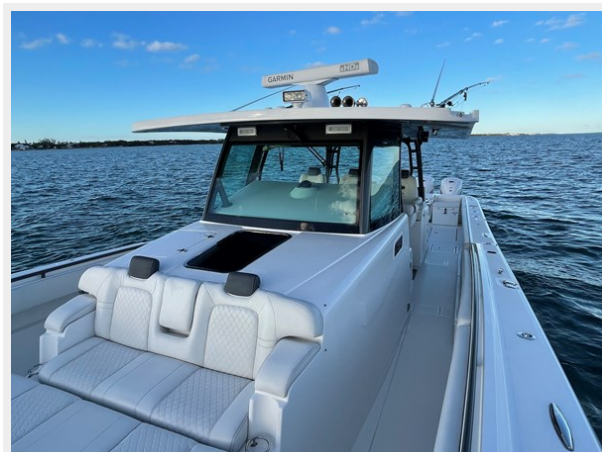
15_2019 53 HCB Suenos FIVE-O