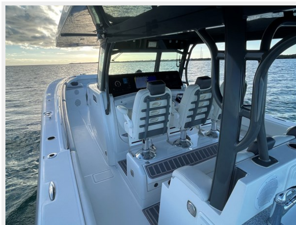
7_2019 53 HCB Suenos FIVE-O