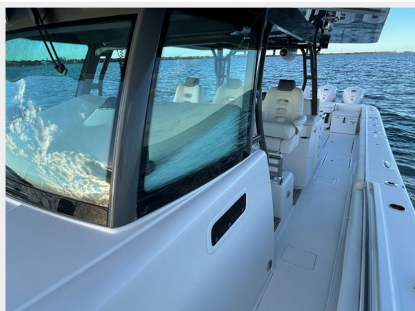
14_2019 53 HCB Suenos FIVE-O