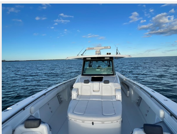
10_2019 53 HCB Suenos FIVE-O