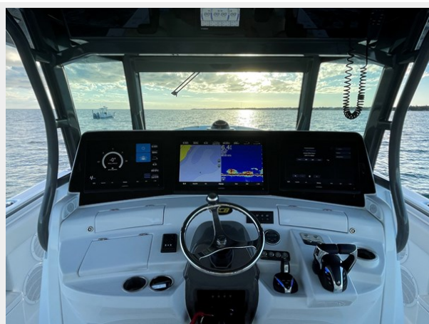
12_2019 53 HCB Suenos FIVE-O