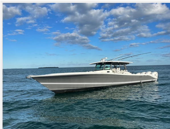
3_2019 53 HCB Suenos FIVE-O