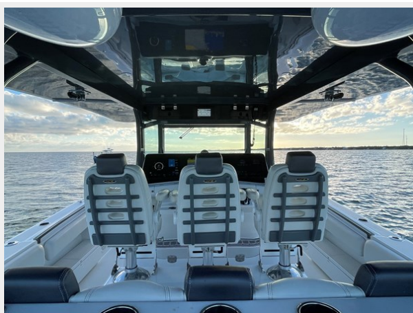
6_2019 53 HCB Suenos FIVE-O