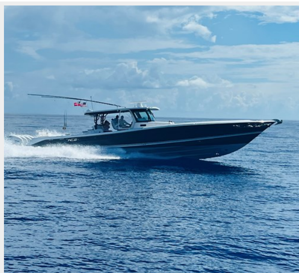
4_2019 53 HCB Suenos FIVE-O