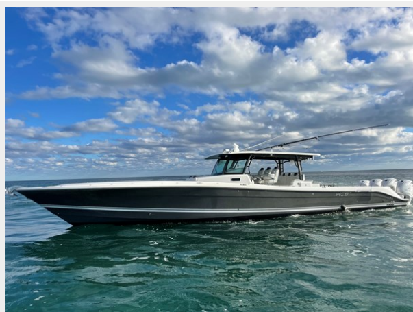
2_2019 53 HCB Suenos FIVE-O