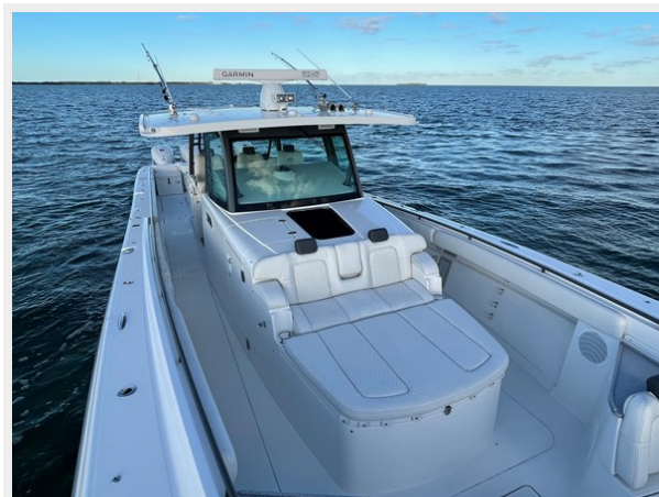
9_2019 53 HCB Suenos FIVE-O