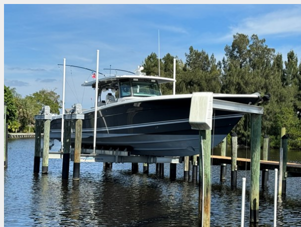
20_2019 53 HCB Suenos FIVE-O