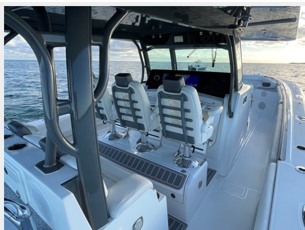
16_2019 53 HCB Suenos FIVE-O