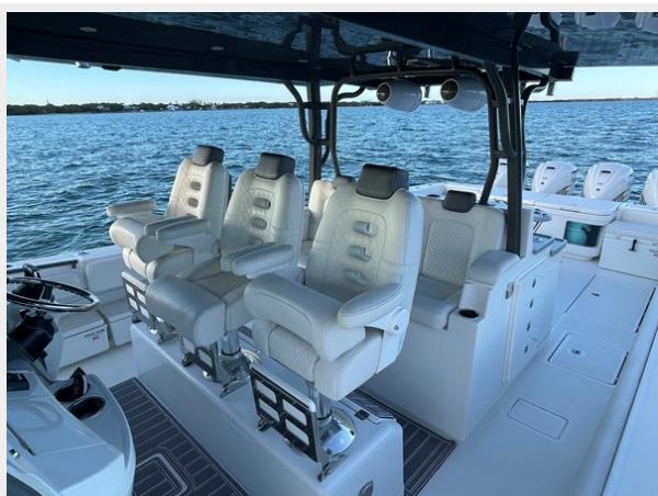
8_2019 53 HCB Suenos FIVE-O