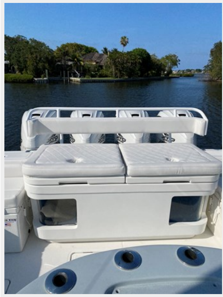
18_2019 53 HCB Suenos FIVE-O