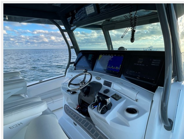
13_2019 53 HCB Suenos FIVE-O