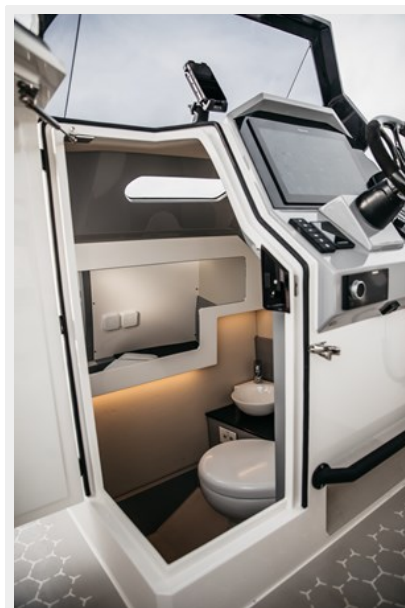
- Ring 1080 - WC with head and sink. 1.6m headroom