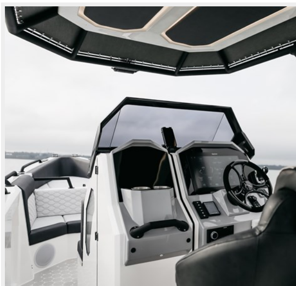
- Ring 1080 - Centre Console - Trophy Edition