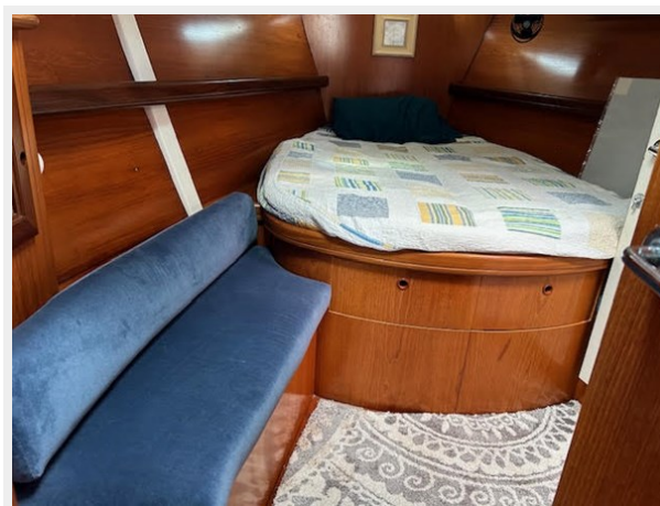
a master 1