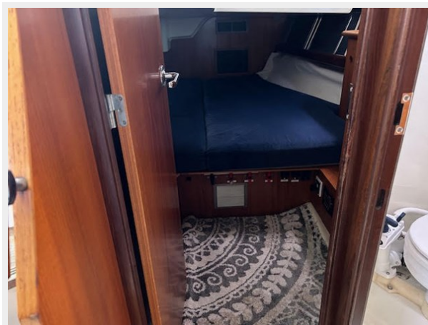
a aft cabin