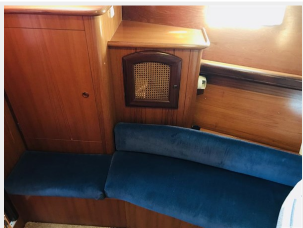
forward cabin 1