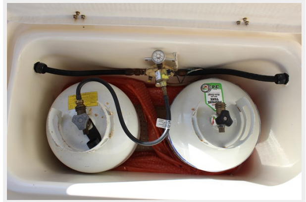
Propane tank stowage locker