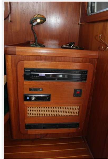
Salon entertainment center