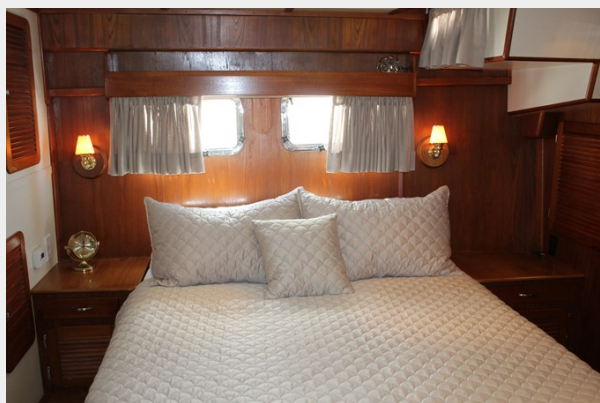
Master, facing port. Note large ports.