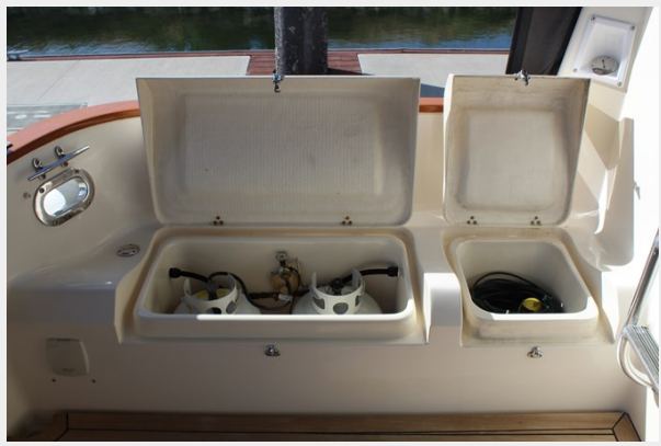
Under bench stowage