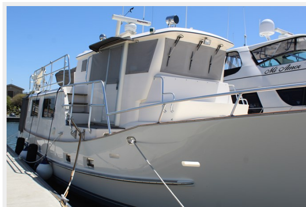
Formidable anchoring set-up