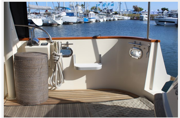
Drop-down entry step