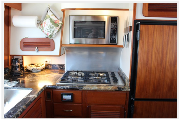
Gas range with convection/microwave above