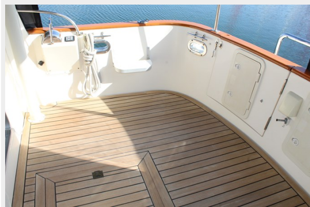
Aft deck with lazette hatch