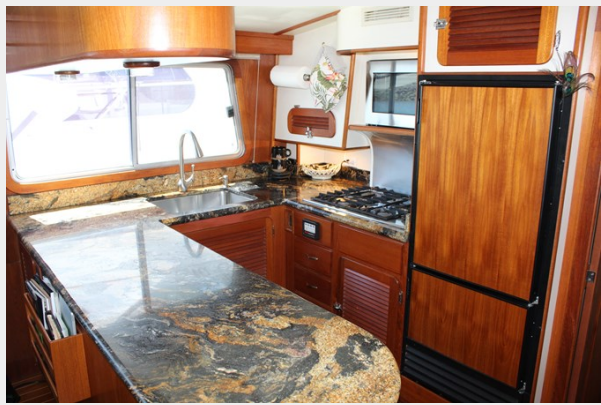
Custom marble countertops