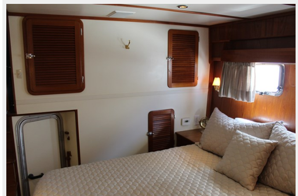
Master engine room access