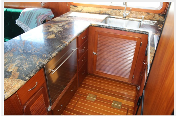
Ample stowage. Dishwasher