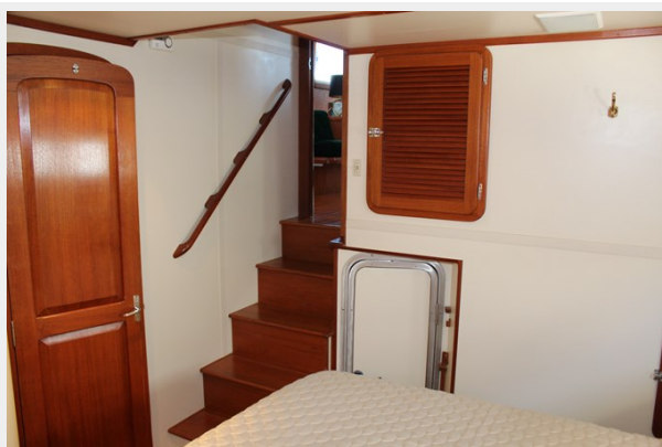
Companionway from master to salon