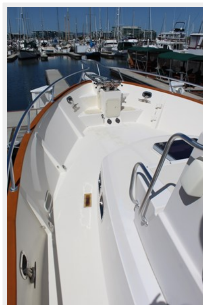
High, safe bulwarks