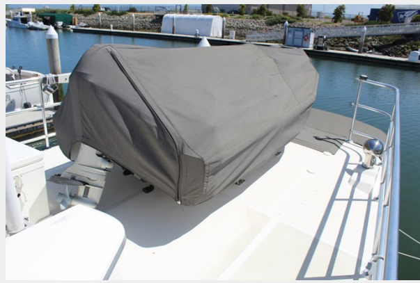
Boat deck and tender