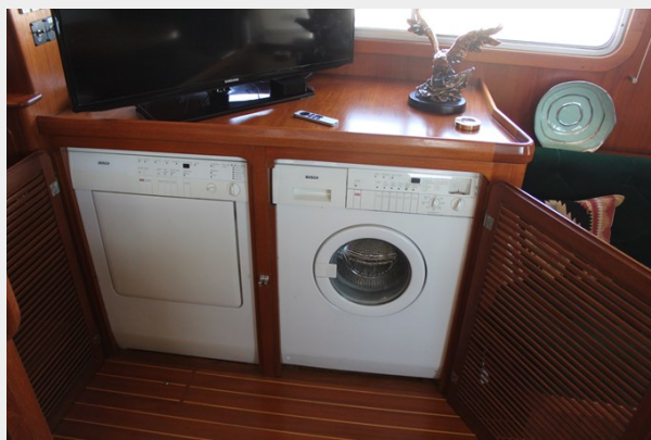
Incredibly convenient Bosch washer & dryer