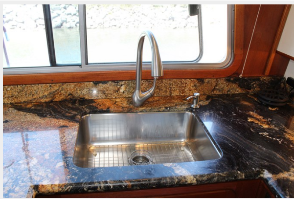
large S/S sink. Opening port