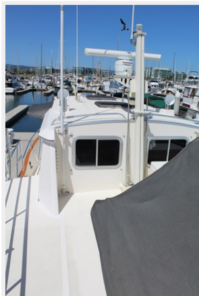
Aft pilot house windows