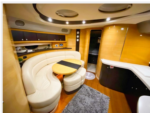
Cranchi 50 - GINGER 17