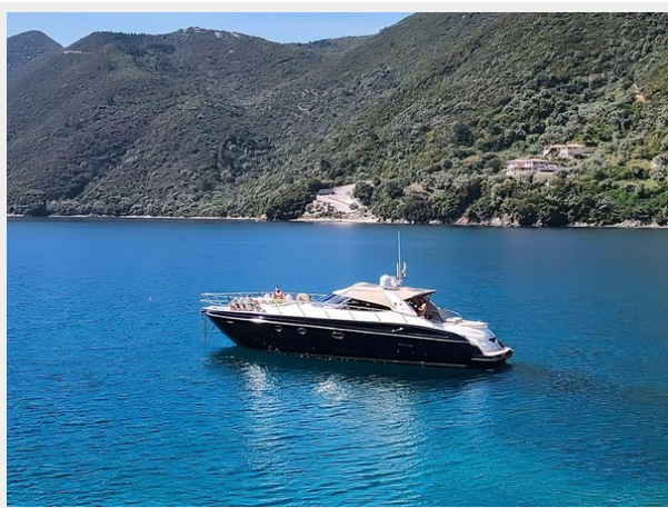
Cranchi 50 - GINGER 3