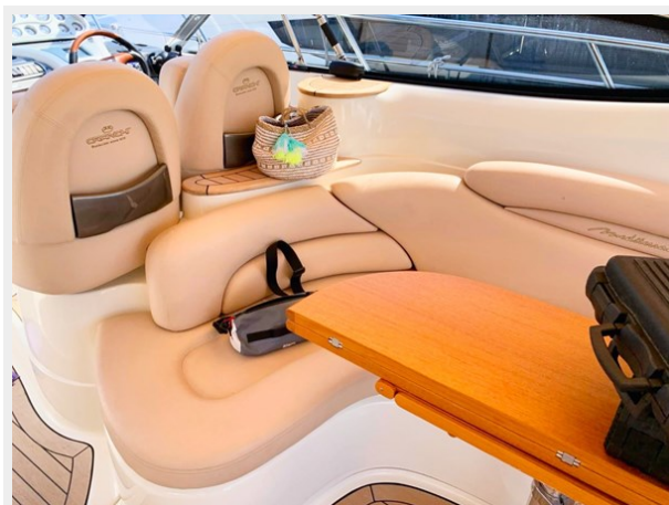
Cranchi 50 - GINGER 15