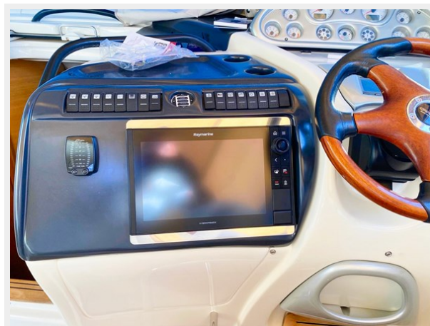
Cranchi 50 - GINGER 16