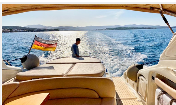
Cranchi 50 - GINGER 13