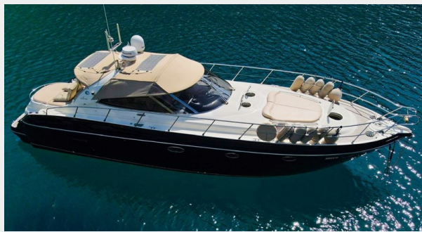
Cranchi 50 - GINGER 1