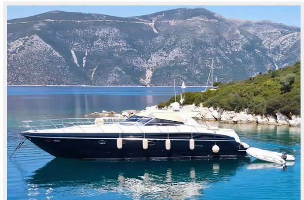
Cranchi 50 - GINGER 4