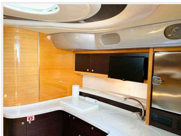
Cranchi 50 - GINGER 19