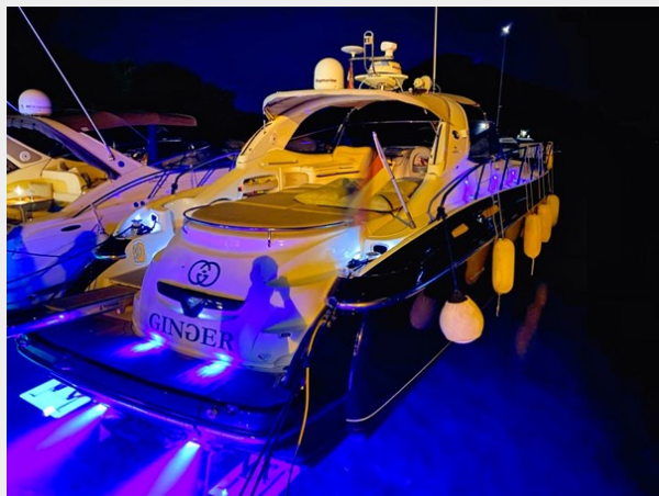
Cranchi 50 - GINGER 8