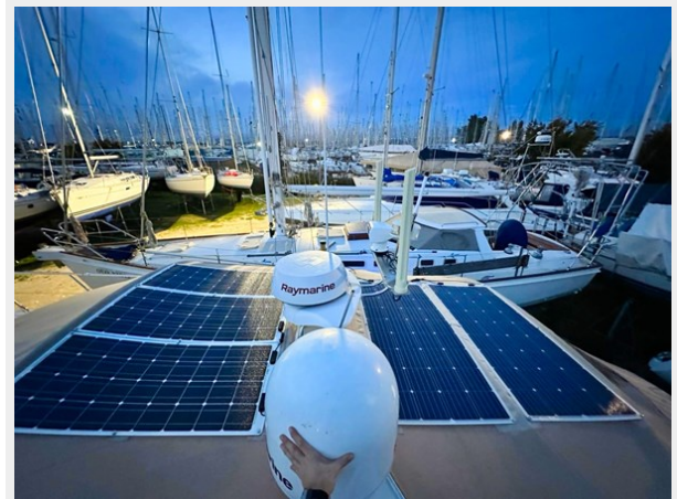
Cranchi 50 - GINGER 9