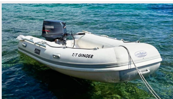
Cranchi 50 - GINGER 5