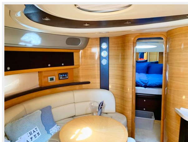
Cranchi 50 - GINGER 18