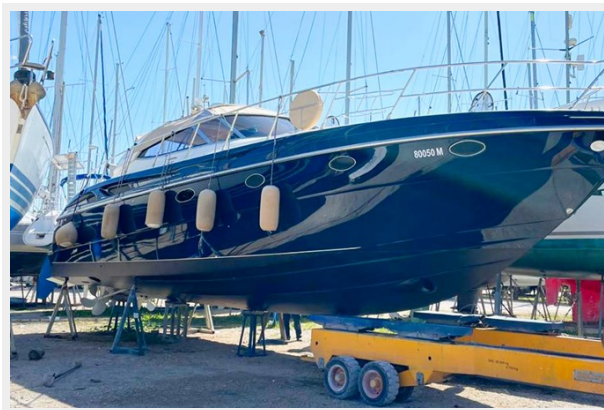
Cranchi 50 - GINGER 10