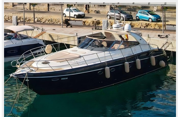
Cranchi 50 - GINGER 2