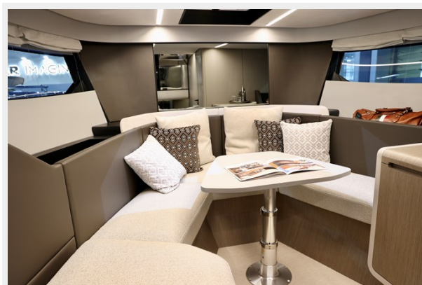
NY40 OUTBOARD LOWER SALON