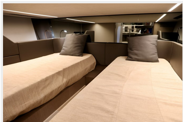
NY40 OUTBOARD MID CABIN