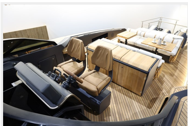
NY40 OUTBOARD COCKPIT