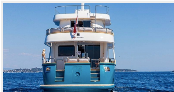
T85 sistership picture 3