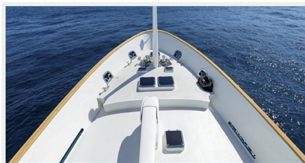
T85 sistership picture 5