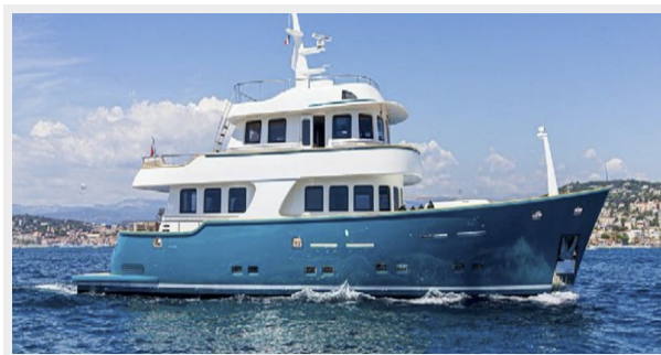
T85 sistership picture