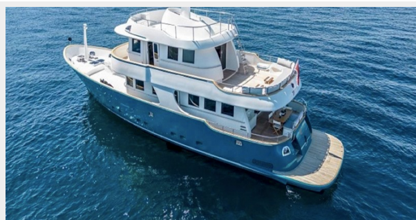
T85 sistership picture 2