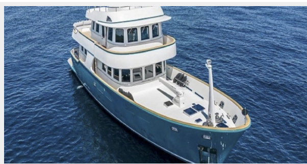
T85 sistership picture 1