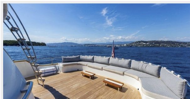
T85 sistership picture 8