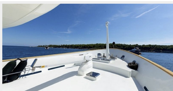
T85 sistership picture 6