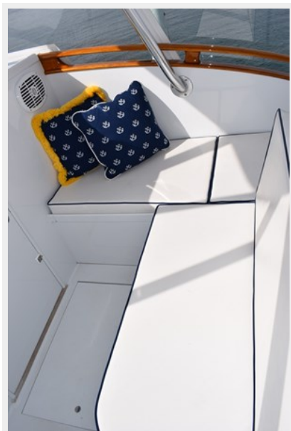
Bridge Deck Seating Forward