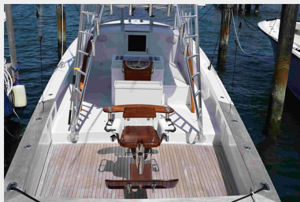
Cockpit Forward View