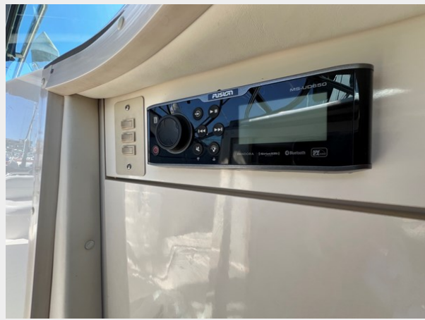
Blue Tooth Fusion Stereo