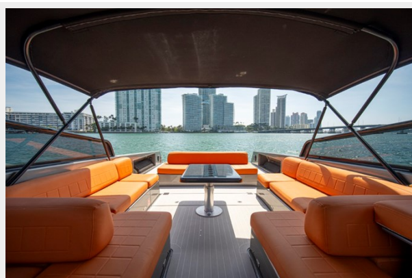
2015 VanDuth 55-21