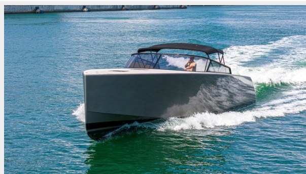
2015 VanDuth 55-4