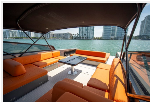
2015 VanDuth 55-22