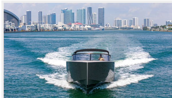
2015 VanDuth 55-5