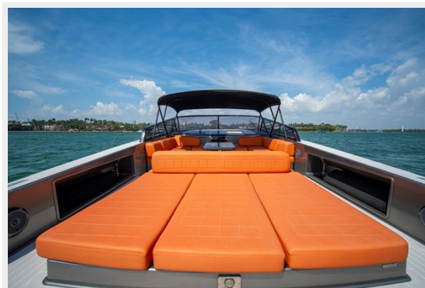
2015 VanDuth 55-33