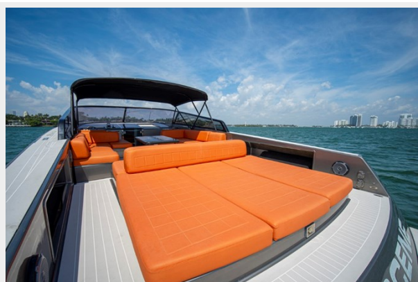
2015 VanDuth 55-34