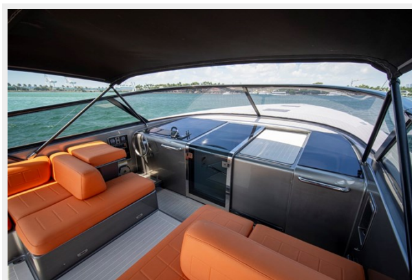
2015 VanDuth 55-27