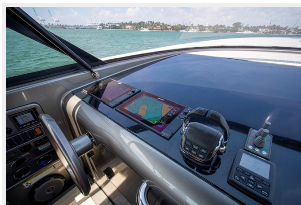
2015 VanDuth 55-31