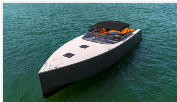
2015 VanDuth 55-19