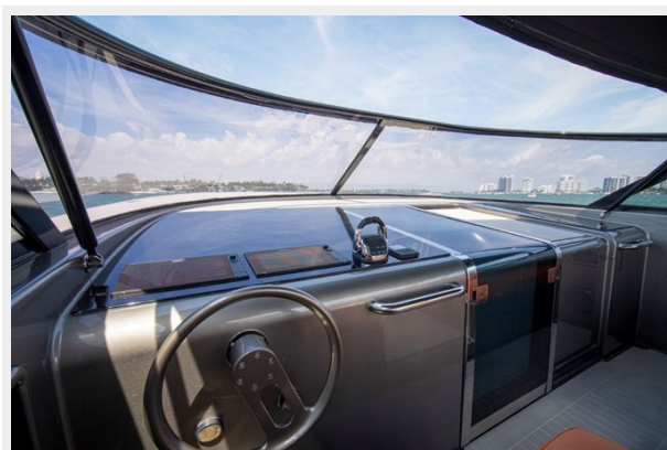
2015 VanDuth 55-30