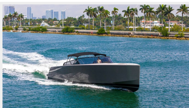
2015 VanDuth 55-8