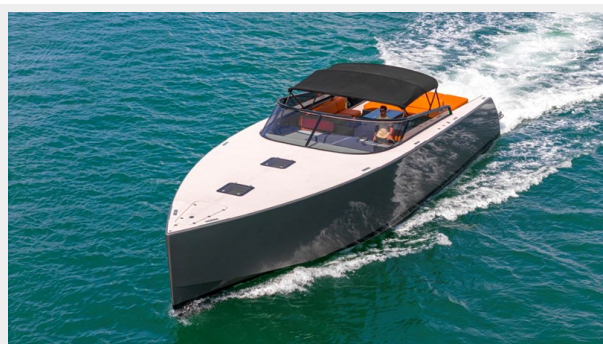
2015 VanDuth 55-13