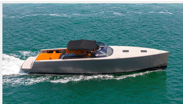
2015 VanDuth 55-17