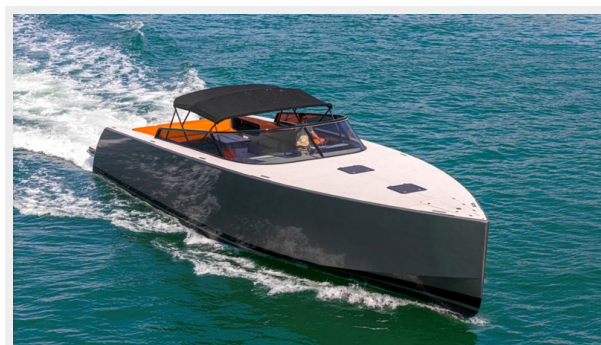
2015 VanDuth 55-12