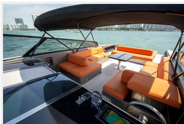
2015 VanDuth 55-38