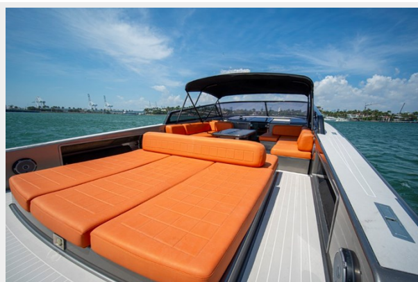
2015 VanDuth 55-32