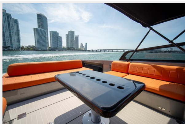
2015 VanDuth 55-28