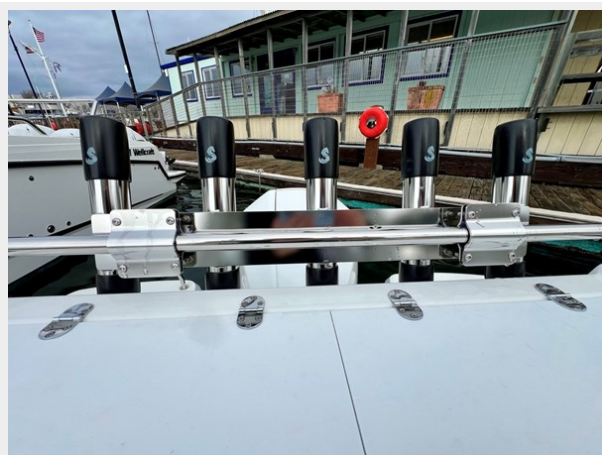
IMG_5862 Large (1)