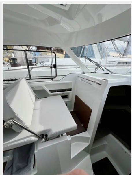
IMG_5860 Large (1)