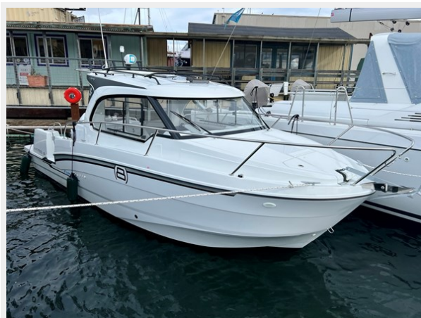
IMG_5841 Large (1)