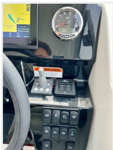
IMG_5849 Large (1)