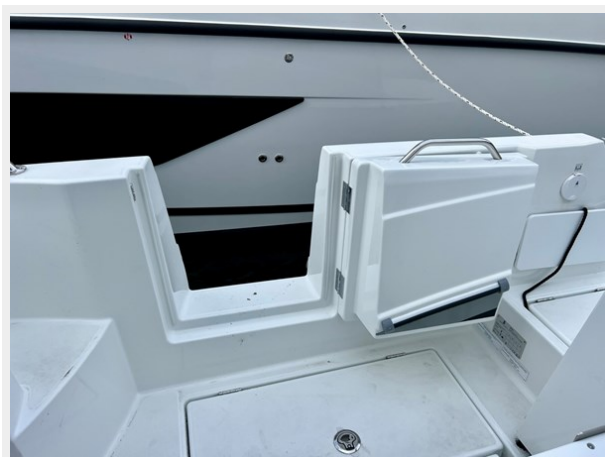
IMG_5843 Large (1)