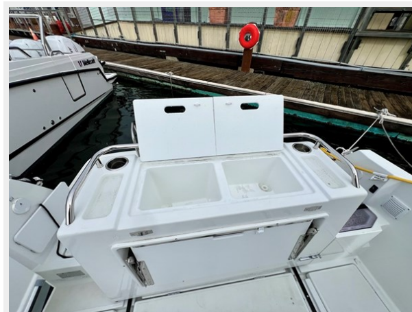
IMG_5861 Large (1)