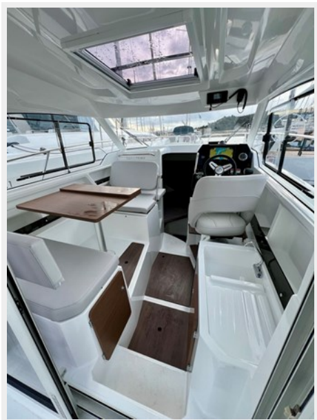
IMG_5844 Large (1)