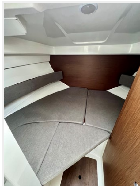
IMG_5853 Large (1)