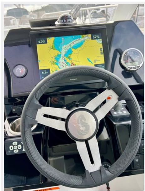
IMG_5848 Large (1)