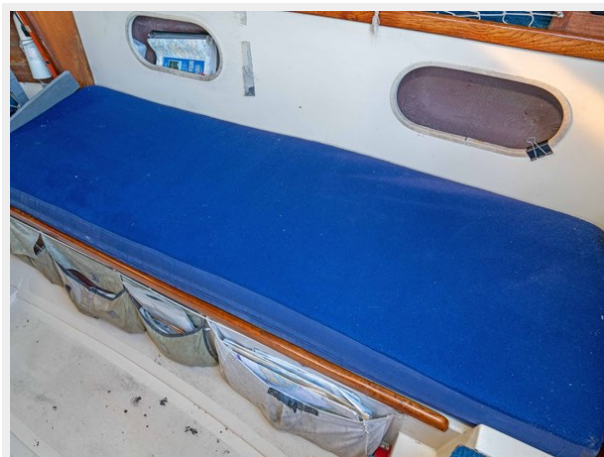
Pacific Seacraft - Saloon