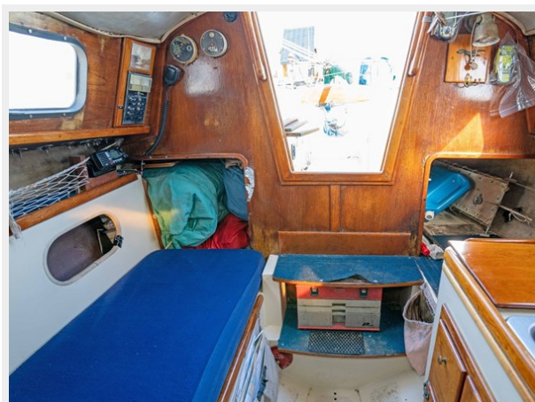
Pacific Seacraft - Looking Aft