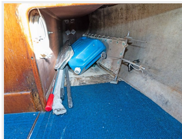
Pacific Seacraft - Aft Cabin 2