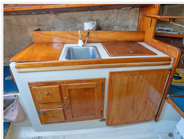
Pacific Seacraft - Galley