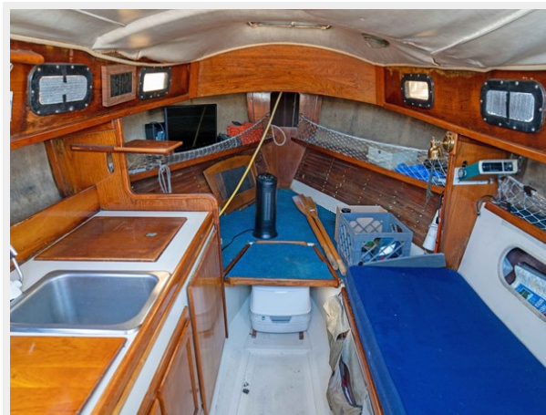
Pacific Seacraft - Looking Forward