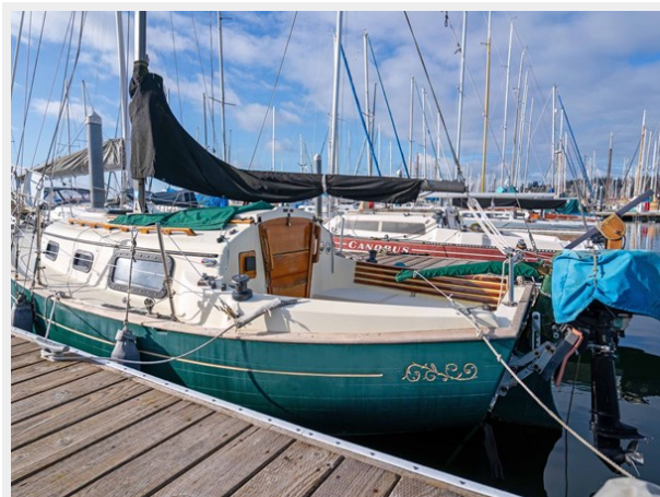
Pacific Seacraft - port side