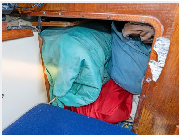
Pacific Seacraft - Aft Cabin