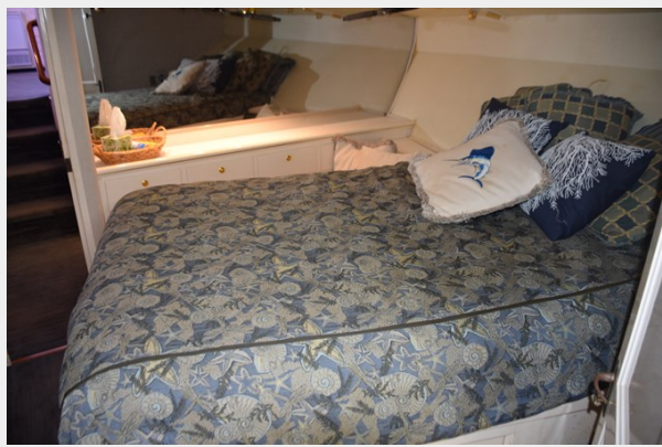
Athwartships berth in Master stateroom forward