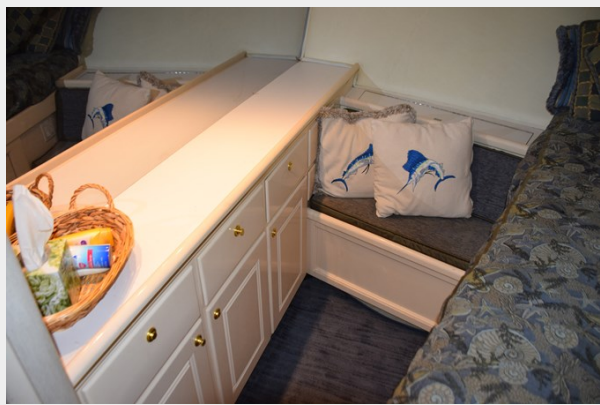
Aft dresser cabinet with mirror above