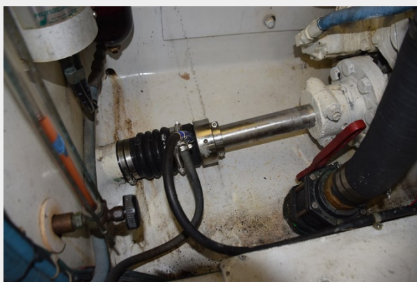
Dripless shaft logs