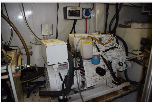
Newer Northern Lights generator