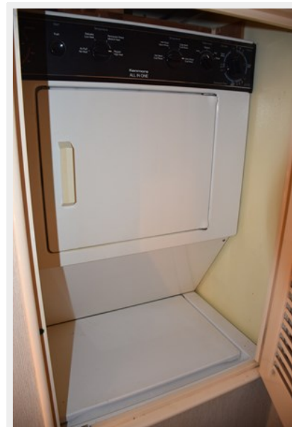
Washer and dryer