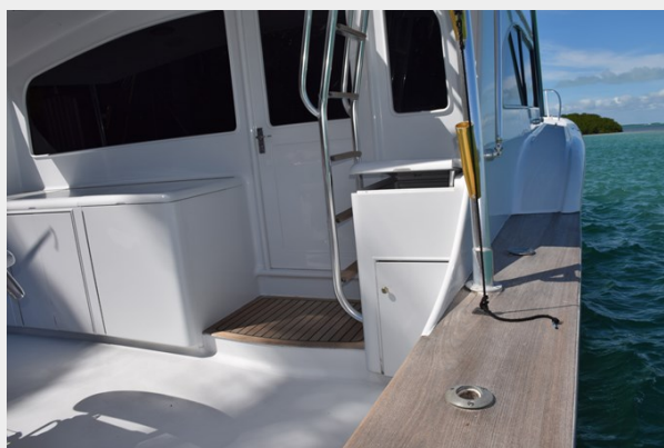
Cockpit and side deck