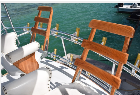
Teak ladderback helm chairs