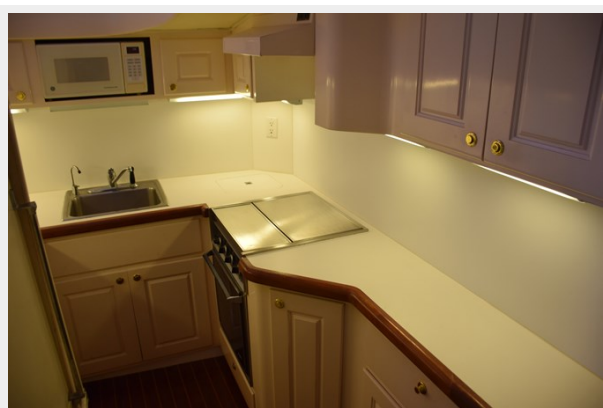
Lots of counterspace