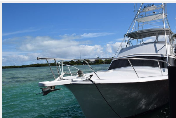
Bow rail with pulpit and windlass