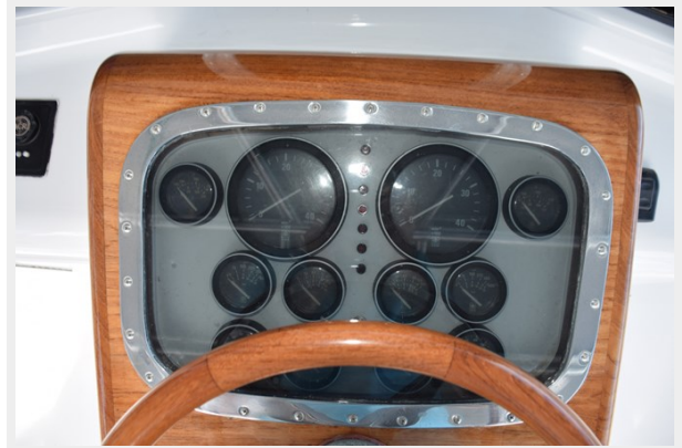
Helm pod with chrome bezel and gauges