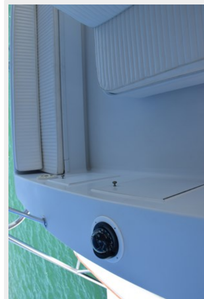
Flybridge passenger seating