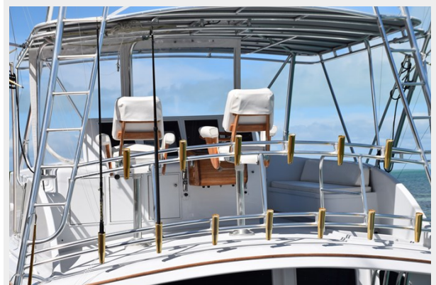
\Flybridge with rod storage on aft railings