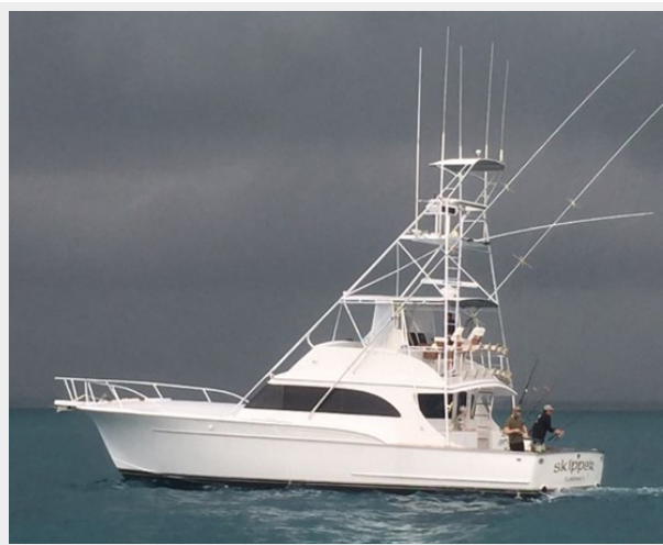
LOW BIDDER X