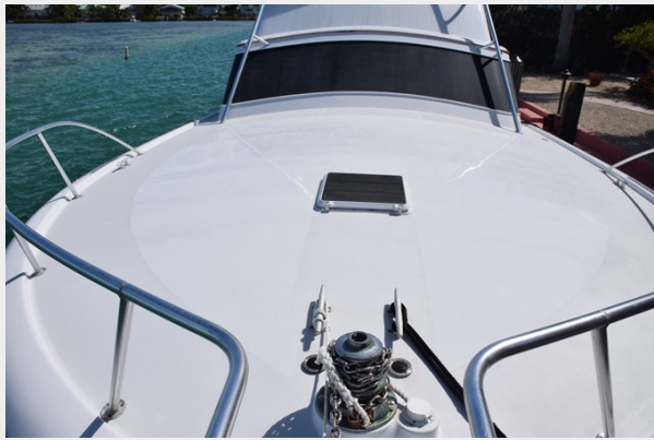
Carolina crowned foredeck