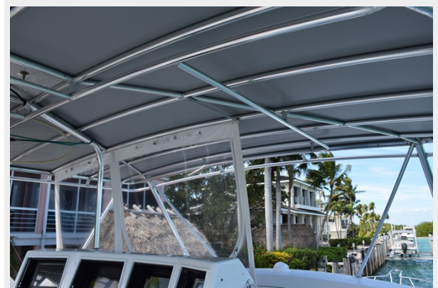
Canvas tower top over flybridge