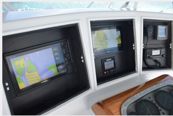
Garmin MFDs and Simrad AP