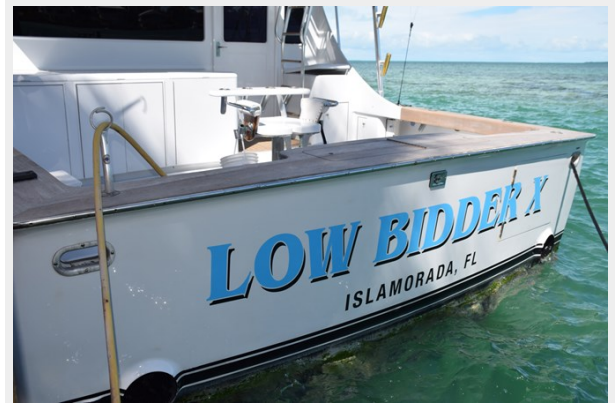
Transom, wide beam