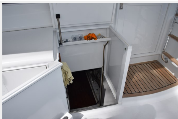
Engine room entrance