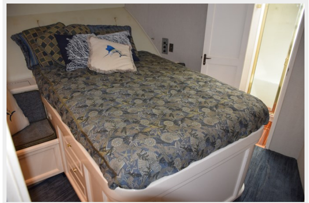
Walkaround queen berth with changing seats on either side of berth