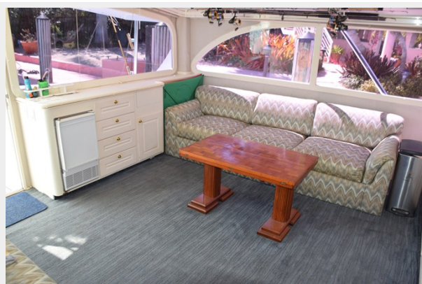
Salon table has opening leaves for dining