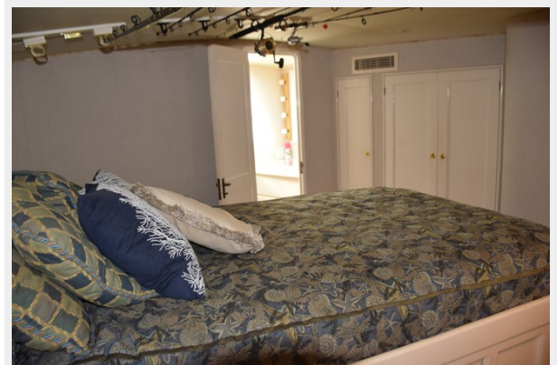
Master head forward with closets on starboard side