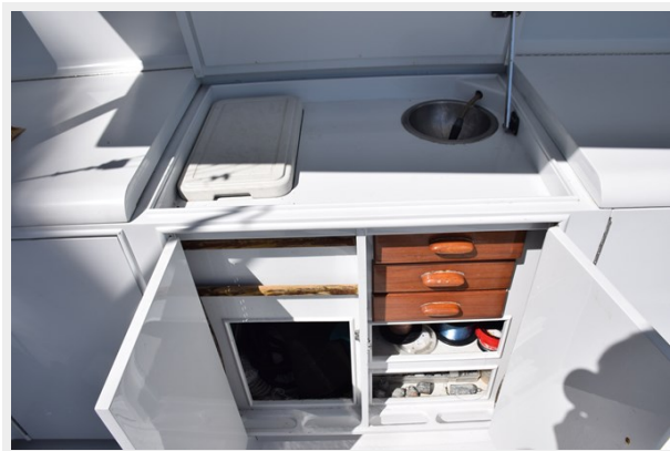
Cockpit tackle center with sink and cooler