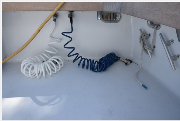
Cockpit washdown hoses