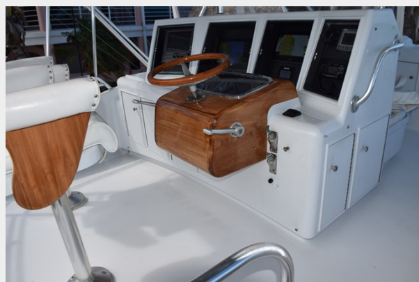
Helm console with safety railings