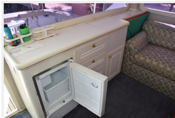
U-line icemaker in aft cabinet