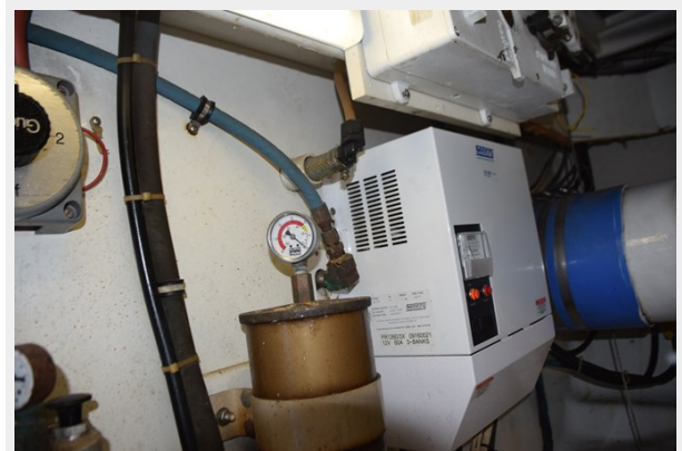
Aft engine room