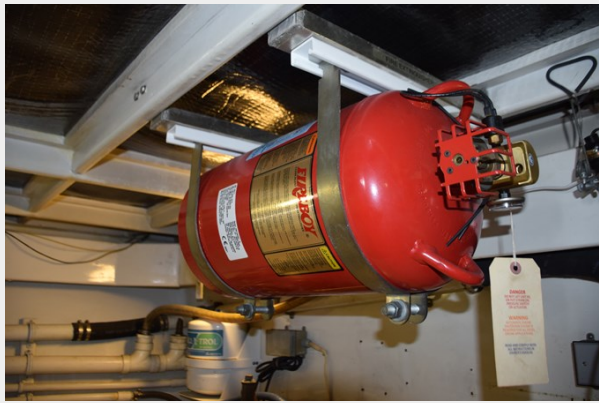
Engine room fire suppression system