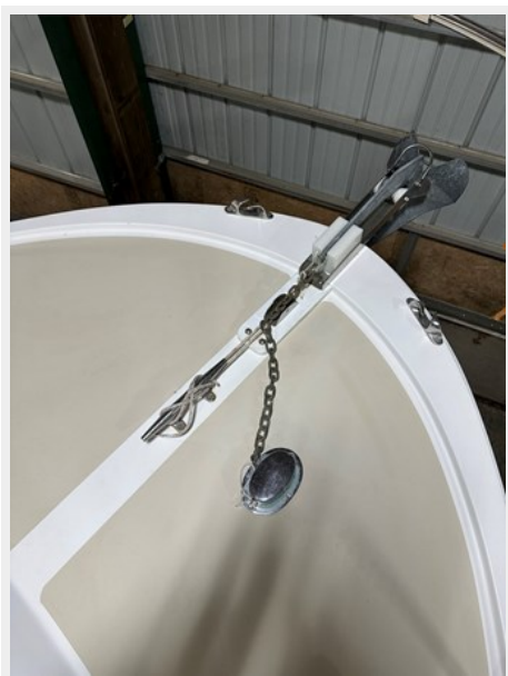
Foredeck and Anchor