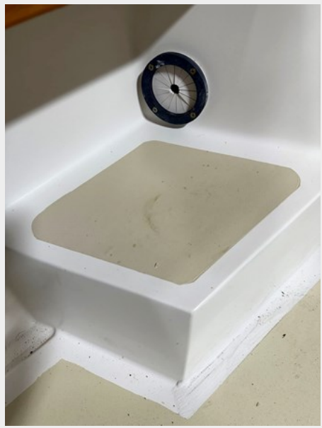
Fishing Rod Extension