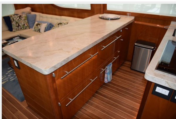
Galley Custom Countertop