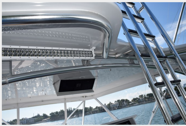
Aft Facing Lightbars