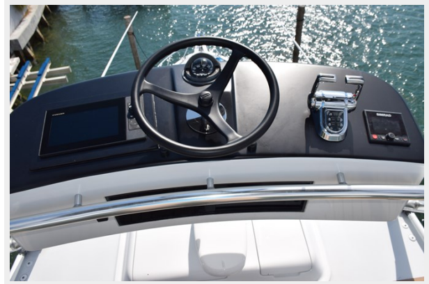
Tower Helm Blacked Out