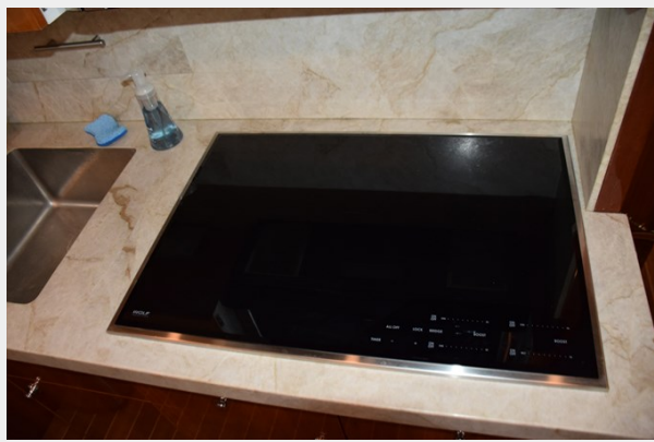
Wolf Induction Stovetop