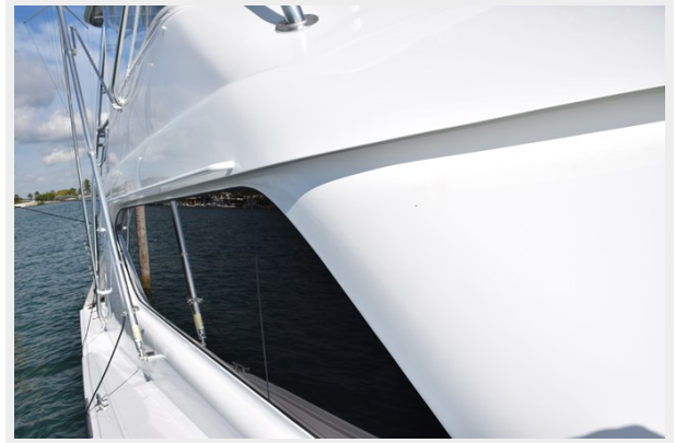
Recent Paint on Deckhouse