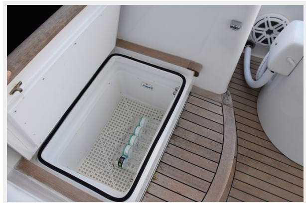
Under Cockpit Step Refrigerated Drink Box