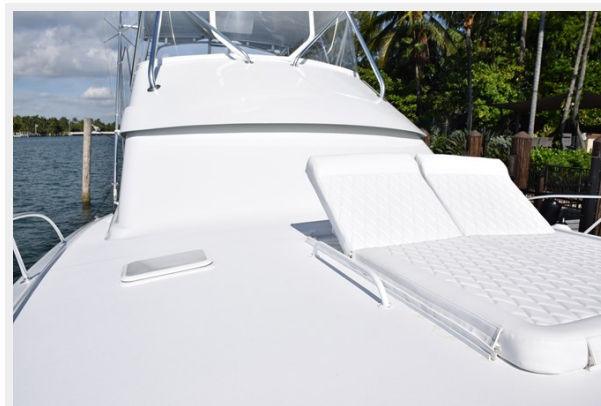
Bow Chaise Loungers