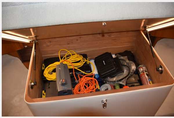
VIP Underberth Storage