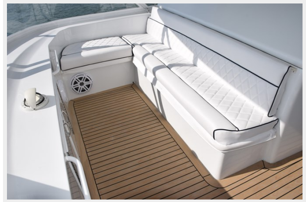
Forward Flybridge Lounge