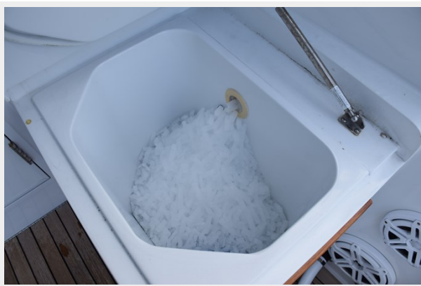
Eskimo Ice Storage Bin