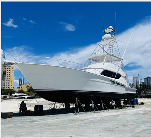
Hauled Out-Bottom Job Done March '24