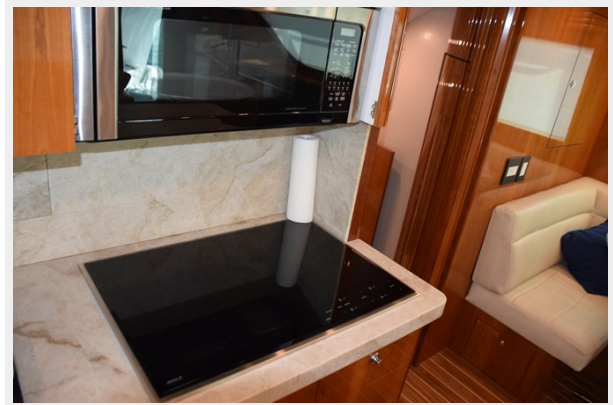
Microwave Convention Behind Cabinet Above Stovetop