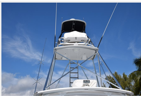
Pipewelders Full Tower with Center Ladder and Blacked Out Tower Station