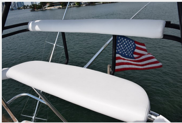
Tower Bench Seat