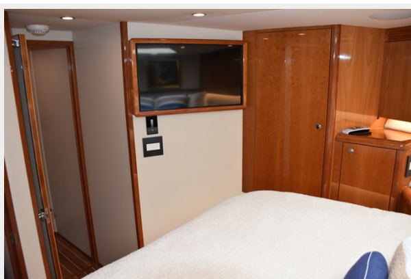
VIP Stateroom 1