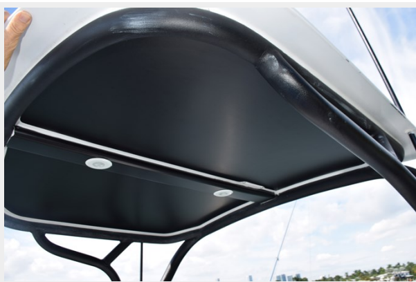
Tower Buggy Top