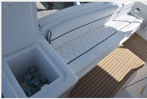
Bentley Stitch Bridge Cushions, Flybridge Drink Box