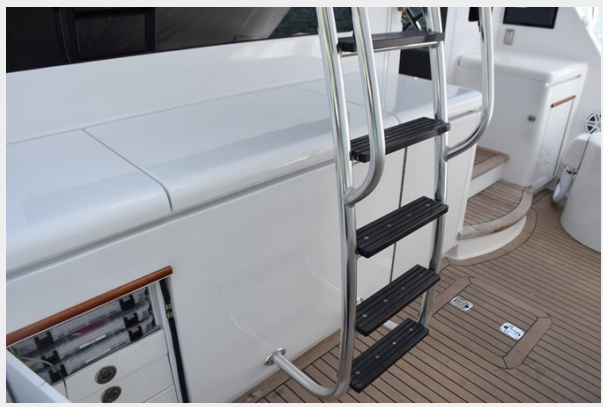
Tackle Drawers in Console and Ladder to Flybridge