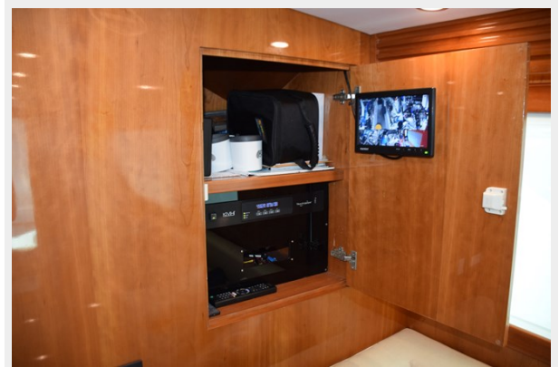
AV Cabinet Forward of Dinette