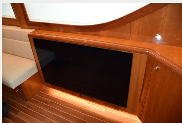
55' Salon Samsung Smart TV