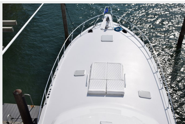
Bow View from Tower