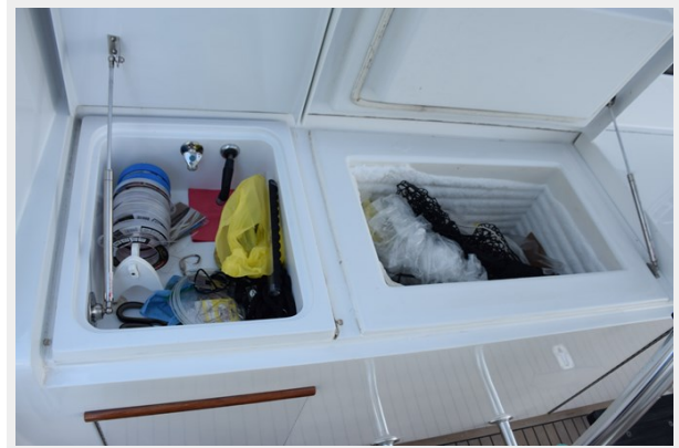
Cockpit Freezer and Rigging Sink