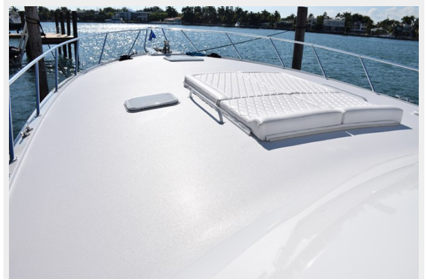
Bow Sunpad, New Bow Railing