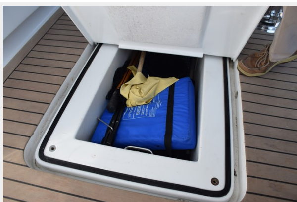
Under Deck Large Fish Box