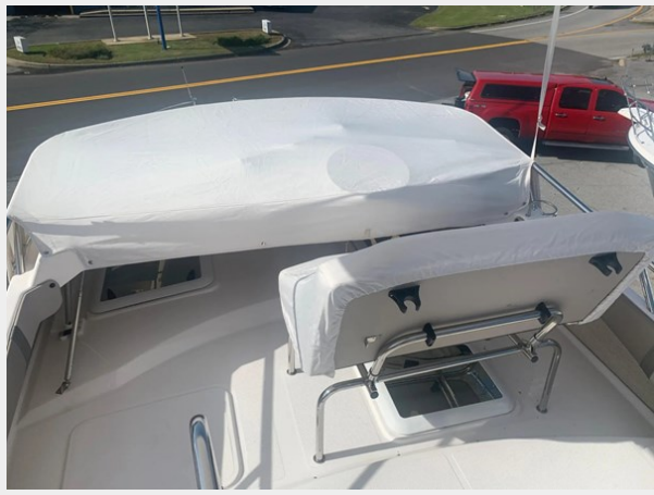
2025 Cutwater 32 Command Bridge Luxury Edition 2025 Cutwater 32 Command Bridge Luxury Edition