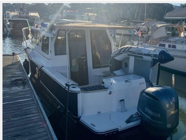
Cockpit from dock