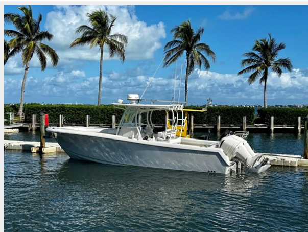
Twin 300 Yamahas