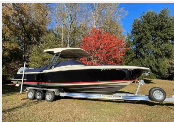
Profile on Trailer