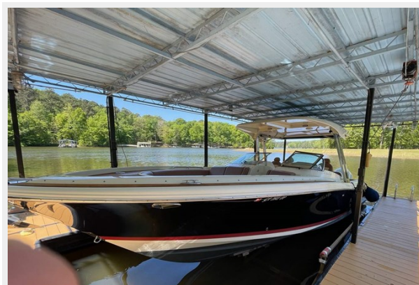
Profile at Dock