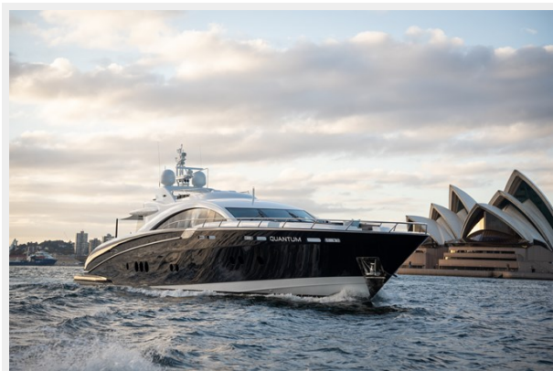
Quantum-164 front right