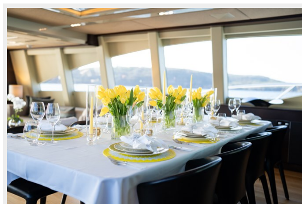
Quantum-45 main salon dining