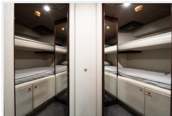
Quantum-94 crew cabin