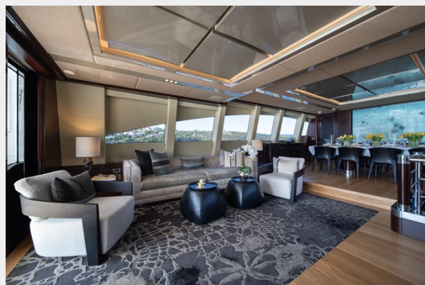
Quantum-47 main salon 2