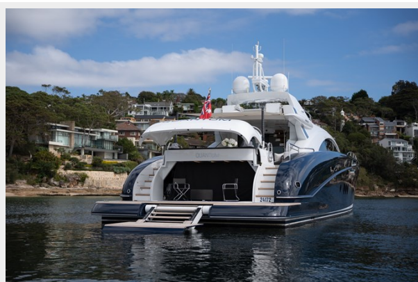
Quantum-102 tender garage