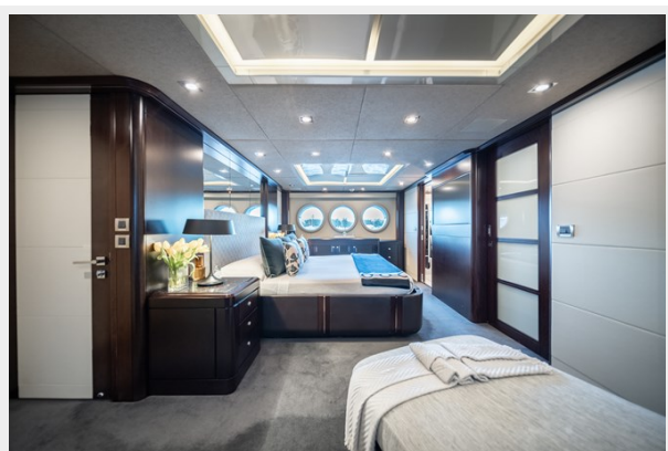
Quantum master cabin