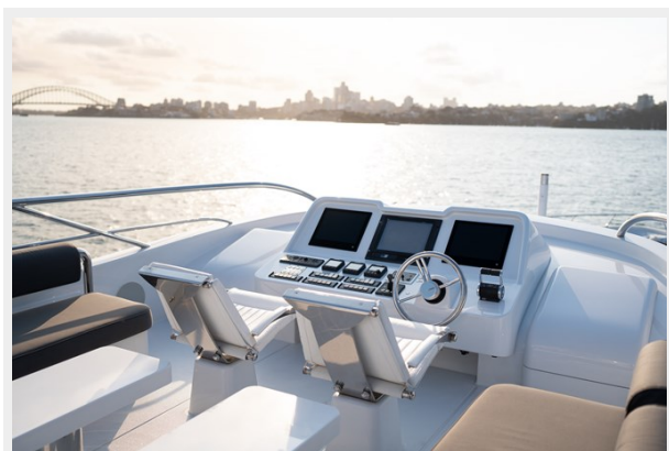
Quantum-37 flybridge helm