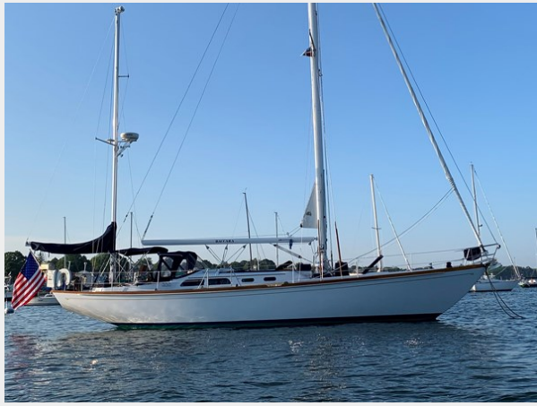
50' Hinckley Sou'wester 1977 (BACCARA) Profile