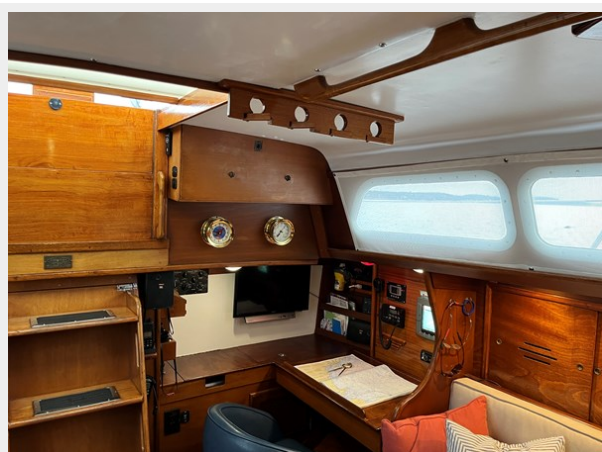
50' Hinckley Sou'wester 1977 (BACCARA) Navigation Station