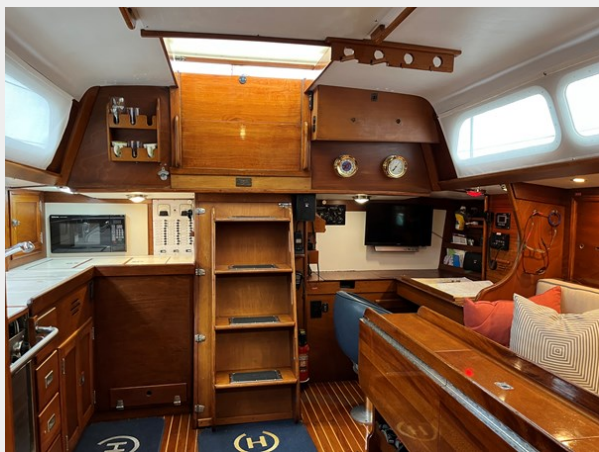
50' Hinckley Sou'wester 1977 (BACCARA) Saloon and Galley