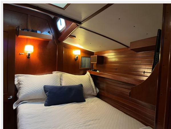
50' Hinckley Sou'wester 1977 (BACCARA) Owner's Stateroom