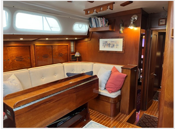
50' Hinckley Sou'wester 1977 (BACCARA) Saloon