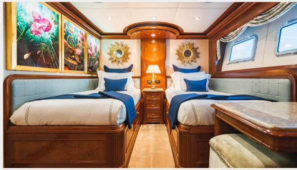
Twin Guest Stateroom