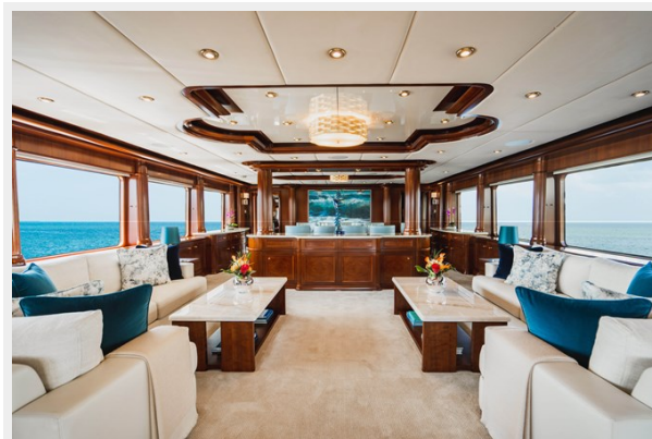
Main Salon, Forward