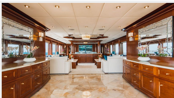
Main Salon Entry