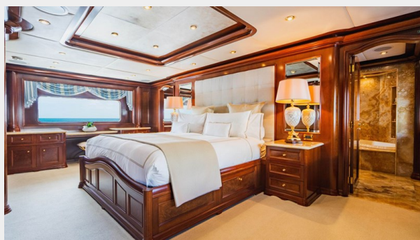
Master Stateroom, On-Deck