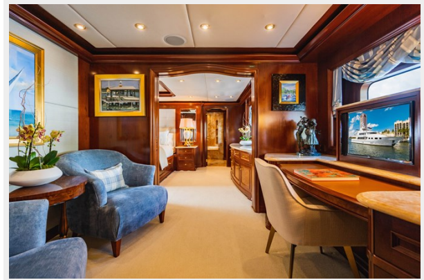
Master Stateroom Office