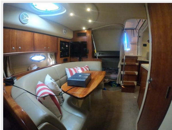
Mid Berth Convertible To Double